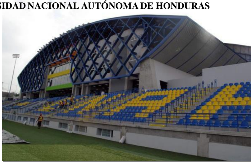
Complejo Deportivo Universitario, Ciudad Universitaria

SECRETARÍA EJECUTIVA DE ADMINISTRACIÓN DE PROYECTOS DE INFRAESTRUCTURA SEAPI-UNAH