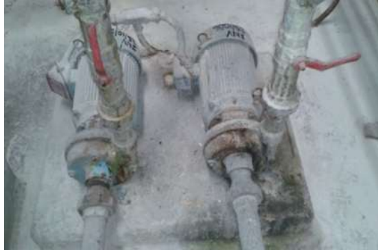
Bomba para solución de Cal