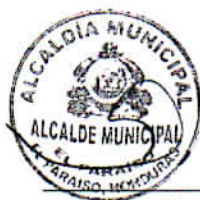
Licda. Ligia Isabel Laínez Alcaldesa Municipal Municipalidad de El Paraíso