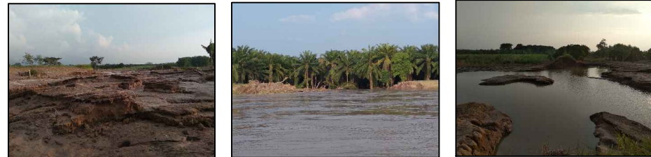
CAMPO LAS FLORES