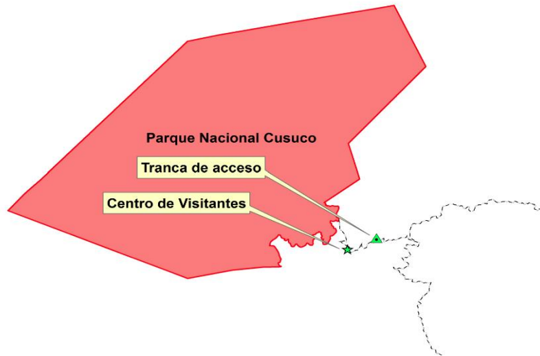
Ilustración 3: Ubicación de Tranca de Acceso.

Como se muestra en la Imagen, Las coordenadas son X= 370028m Y= 1713589 m Z=1603m.