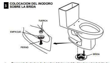
3 COLOCACIÓN DEL INODORO SOBRE LA BRIDA a. Desconecte la abertura de desechos del piso e instale el inodoro sobre la brida de manera que los tornillos de fijación salgan por los agujeros de montaje. b. Instale sin apretar las arandelas de retención y las tuercas. El lado de las arandelas marcado con "THIS SIDE UP" (Este lado hacia arriba) debe ir hacia arriba.