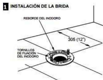
1 INSTALACIÓN DE LA BRIDA Instale los tornillos de instalación del inodoro en el canal de la brida, gire 90° y acomóde a 12" (305 mm) de la pared.

Todo inodoro en la obra debe ser instalado con brida y sello considerando la distancia mínima de 12" desde la pared hacia la ubicación del centro del conector de desagüe