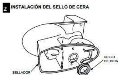
2 INSTALACIÓN DEL SELLO DE CERA Invierta el inodoro en el piso (protéjalo con una almohadilla para prevenir daño), e instale el anillo de cera de manera uniforme alrededor del reborde de salida del agua. Aplique un borde delgado de sellador alrededor de la base del inodoro.