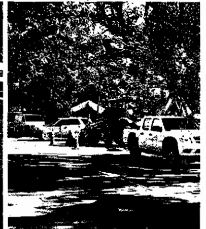
DAÑOS. El derrame de agua en la 4 calle y 16 avenida tiene más de un mes y afecta dos cuadras. Ayer personal de ASP cerró parte de la 5 calle pero para otra reparación.