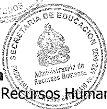
Raquel Umazor Oficial de Adquisiciones Programas y proyectos BID