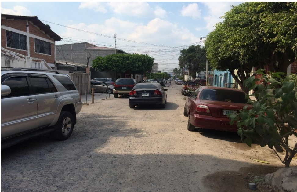
Fin de pavimento