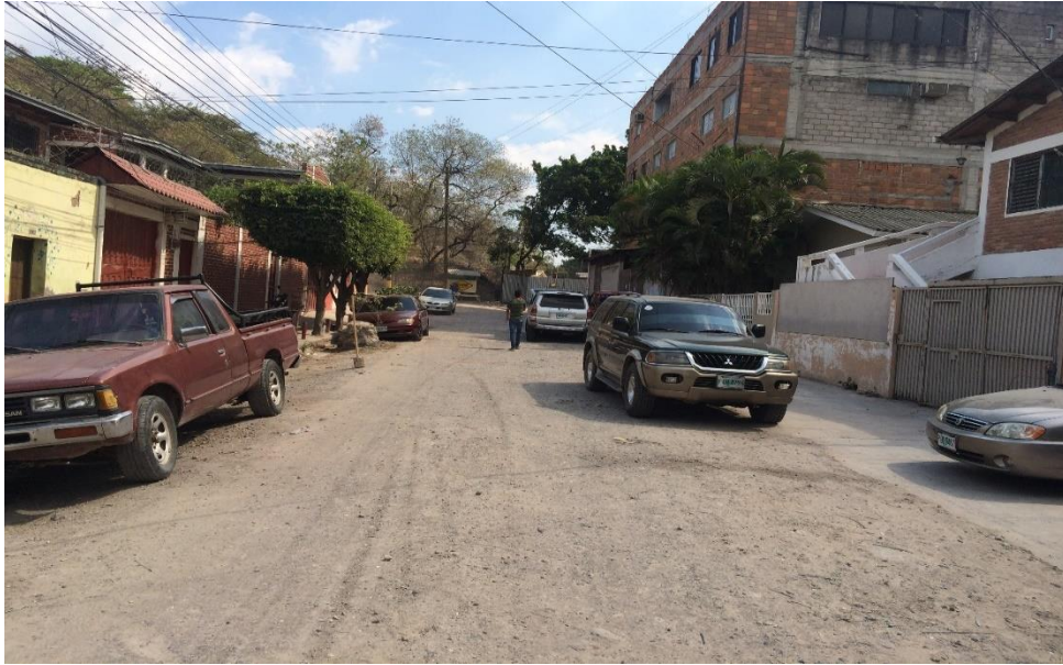
Condiciones actuales de la calle

Proyecto: Pavimentación de calle con concreto hidráulico, Barrio La Granja Código: 1159