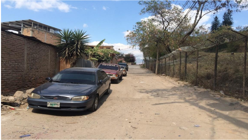
Condiciones actuales de la calle