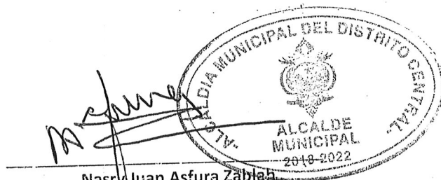
Nasr Juan Asfura Zablah Alcalde Municipal