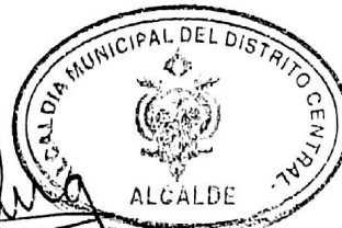
Nasry Juan Asfura Zablah Alcalde Municipal