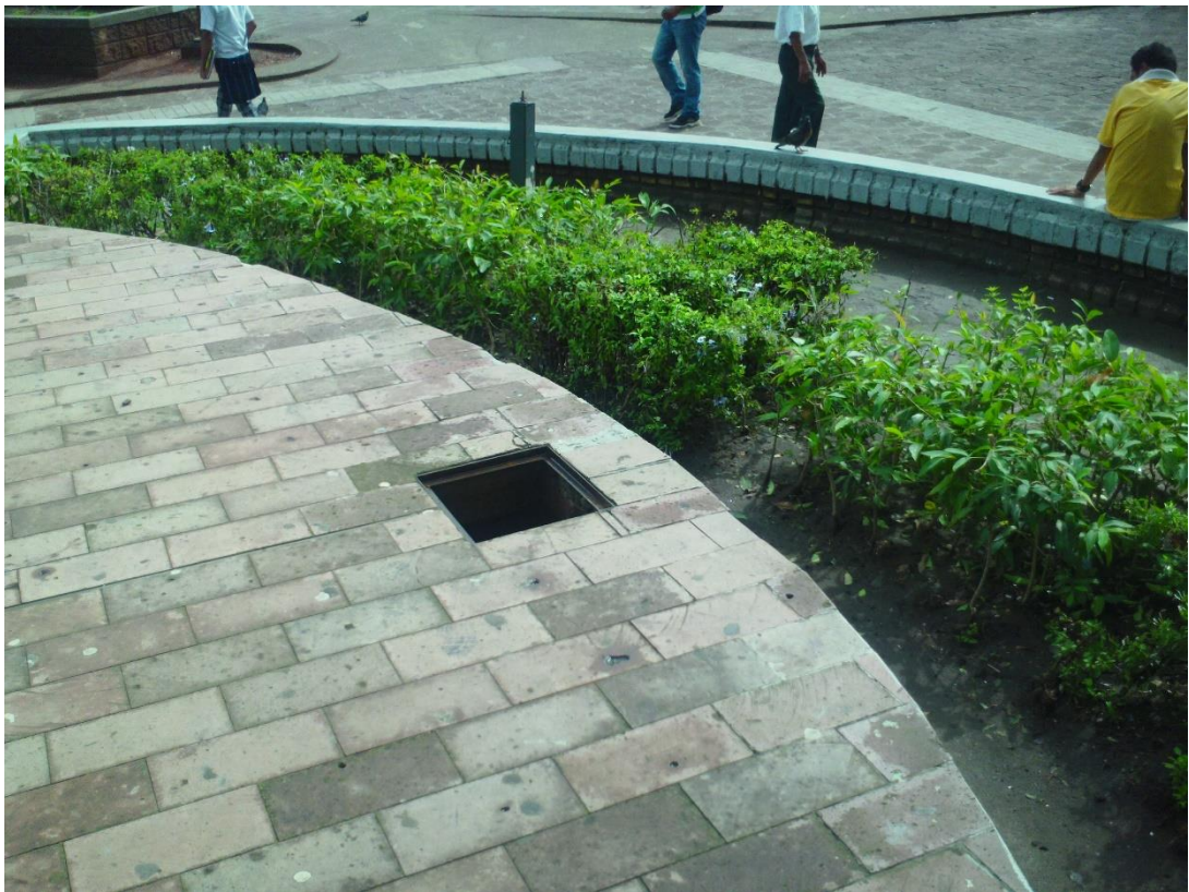
Situación actual de piso y ubicación de reflectores del monumento a Francisco Morazán