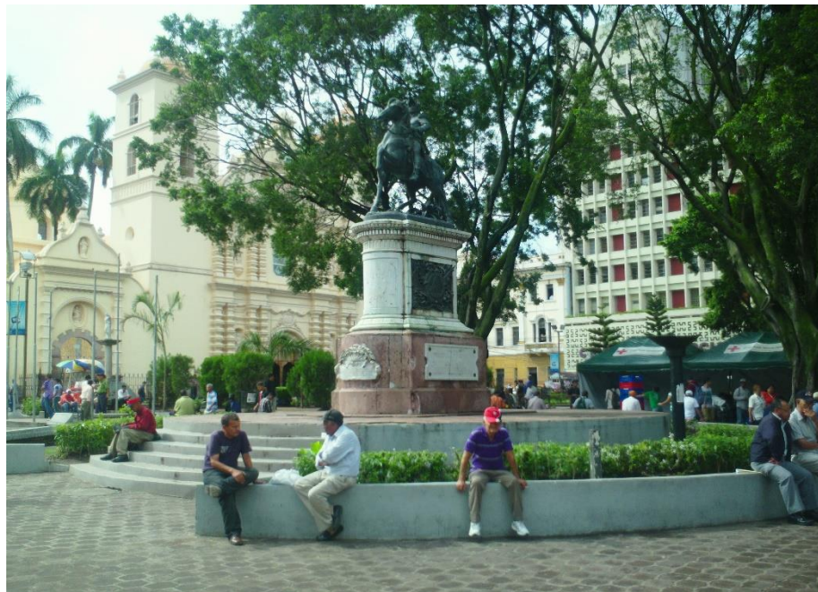
Vista del Monumento a Francisco Morazán