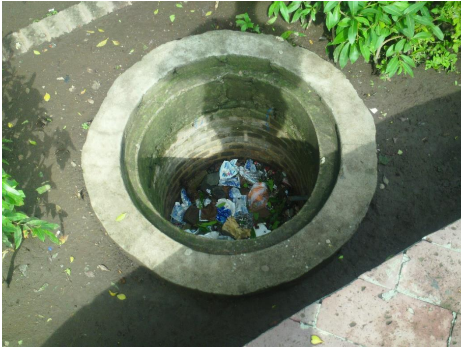
Situación actual jardinería.