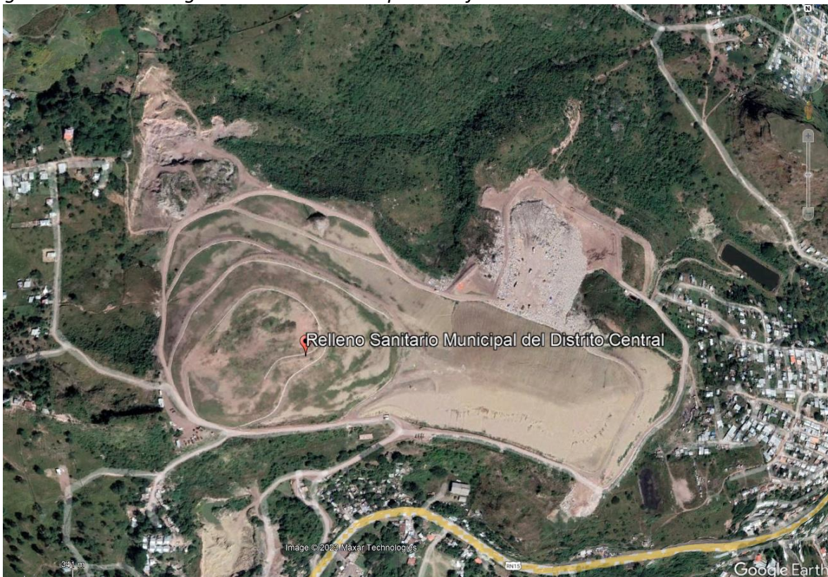
Figura 1 Localización general del sitio de disposición final

Los residuos sólidos recolectados en las ciudades de Tegucigalpa y Comayagüela (Distrito Central), ciudad capital de la República de Honduras, desde la década de 1970 han sido depositados en un terreno propiedad de la Alcaldía Municipal del Distrito Central (AMDC) localizado aproximadamente en el Kilómetro 6.5 al costado occidental de la carretera que desde Tegucigalpa conduce al Departamento de Olancho.