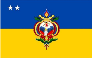
IMAGEN DE BANDERA DE AMDC