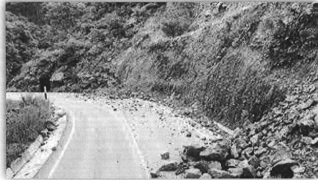
En la imagen se muestra la problemática por deslizamientos debido a la inestabilidad en taludes durante la época de invierno