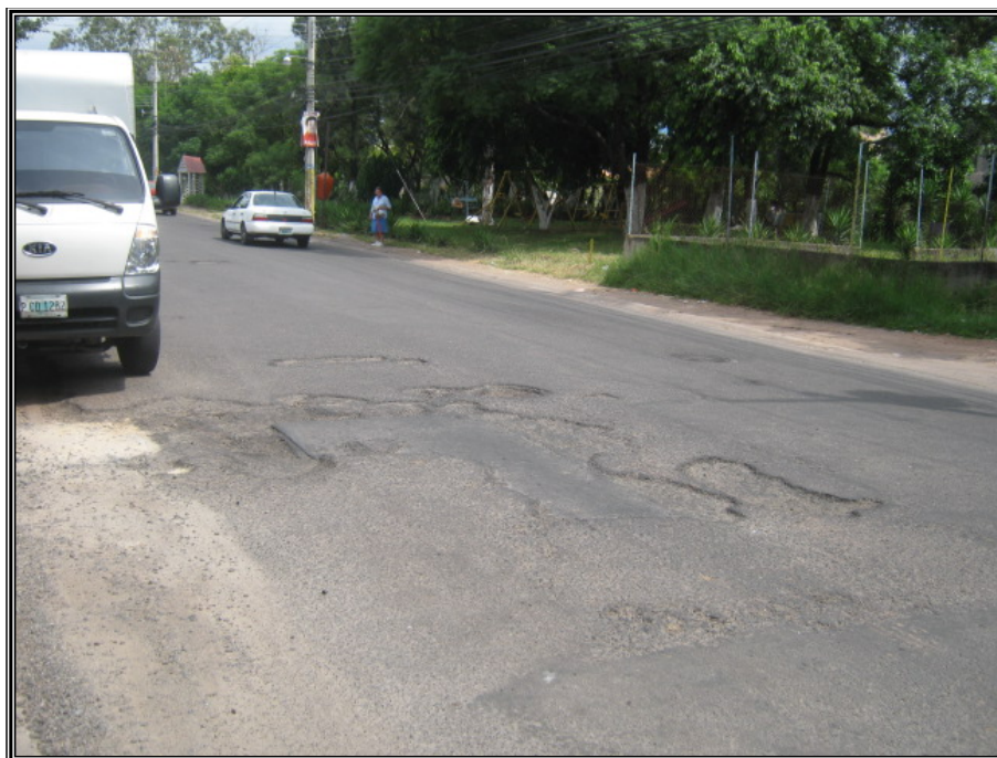
Colonia El Hogar.