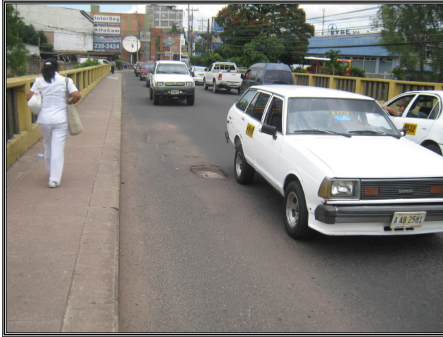
Col. El Prado.