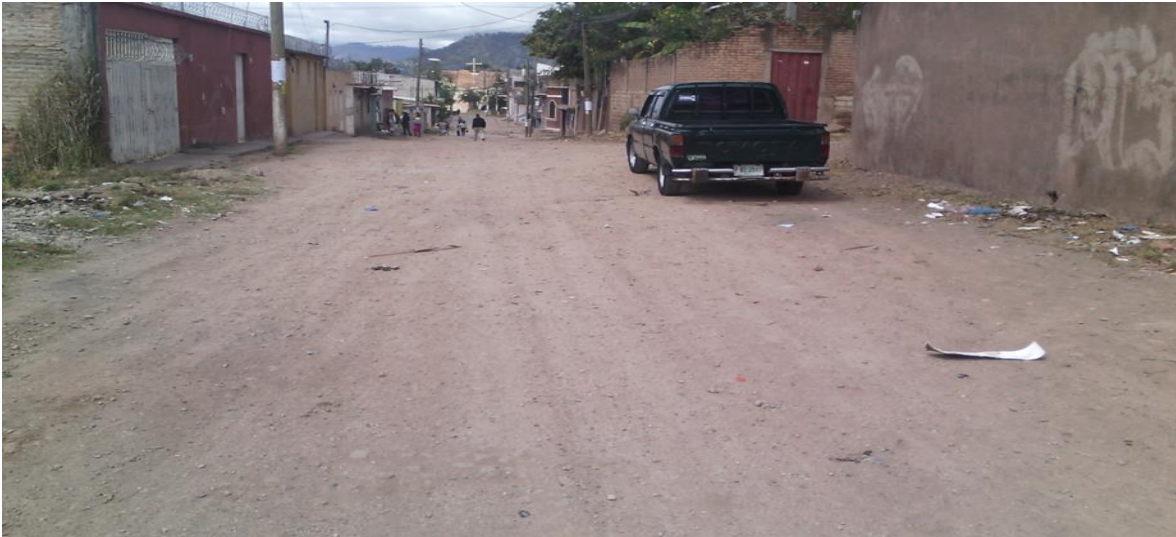
Inicio de la calle a pavimentar

Proyecto: Pavimentación de calles con concreto hidráulico, col. San Miguel, calle Trinidad Código: 706