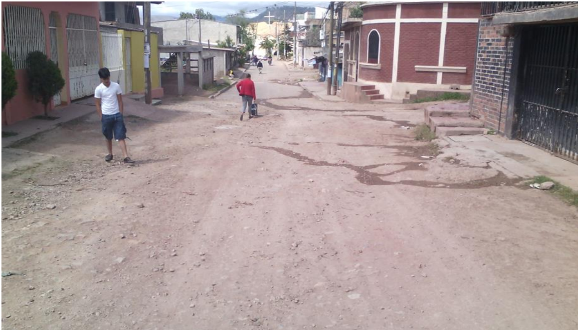
Fin de calle a pavimentar