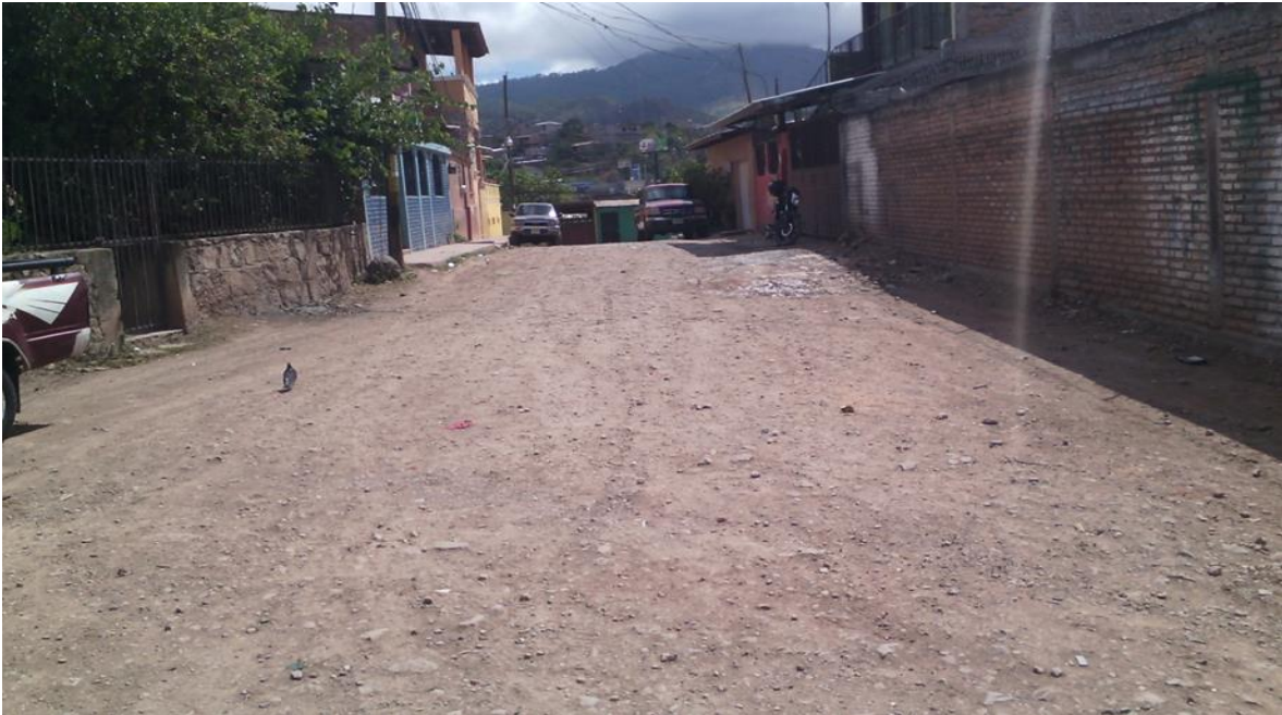
Vista de la sección de la calle

Proyecto: Pavimentación de calles con concreto hidráulico, col. San Miguel, calle Trinidad Código: 706