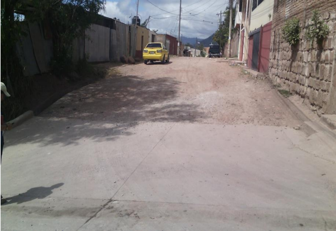
Vista panorámica de la calle