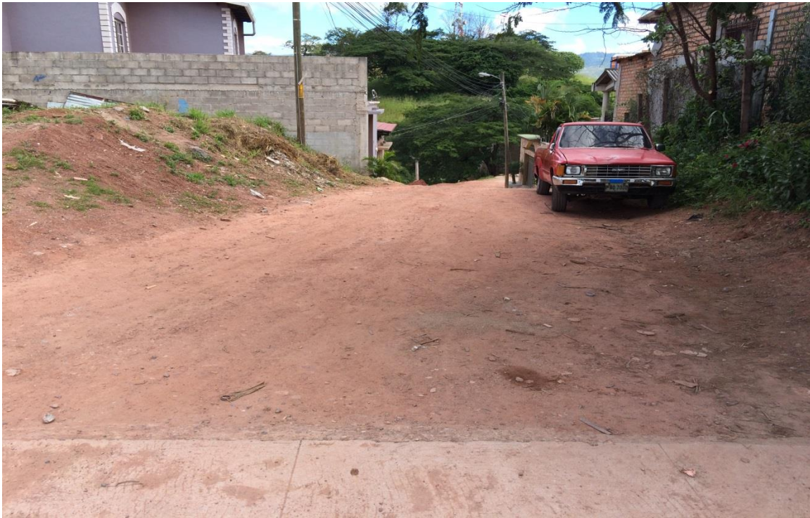
Inicio de pavimentación de calle