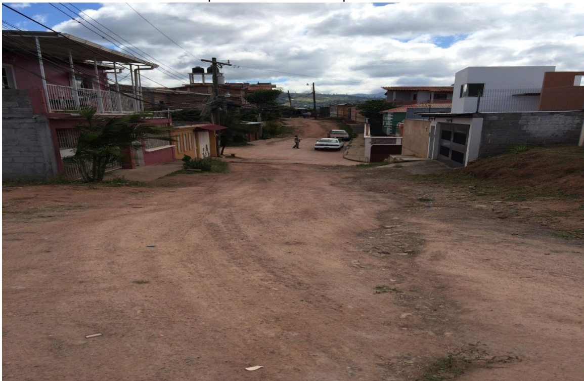
Final de calle a pavimentar