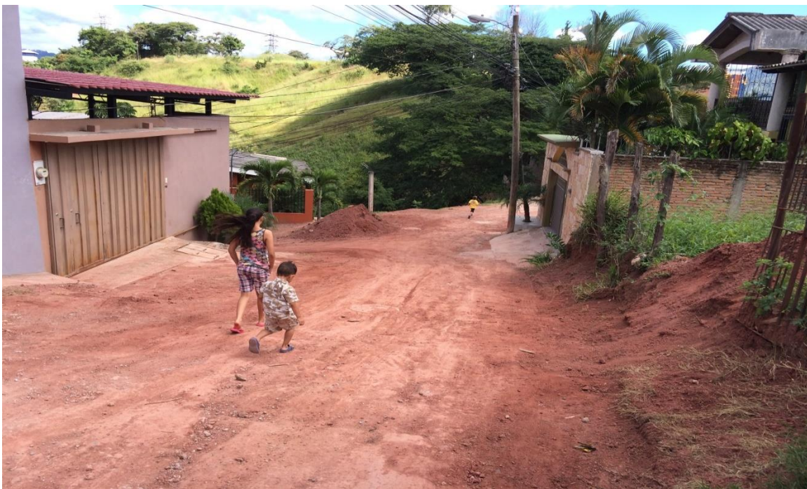
Tramo de calle a pavimentar en col. Altos de La Joya