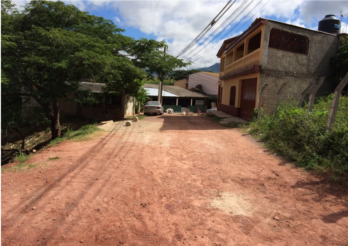
Vista panorámica de calle a pavimentar