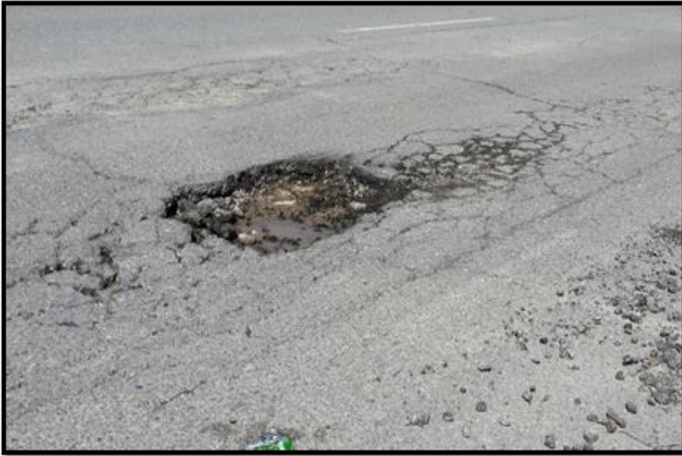
Vista del deterioro de la calle existente