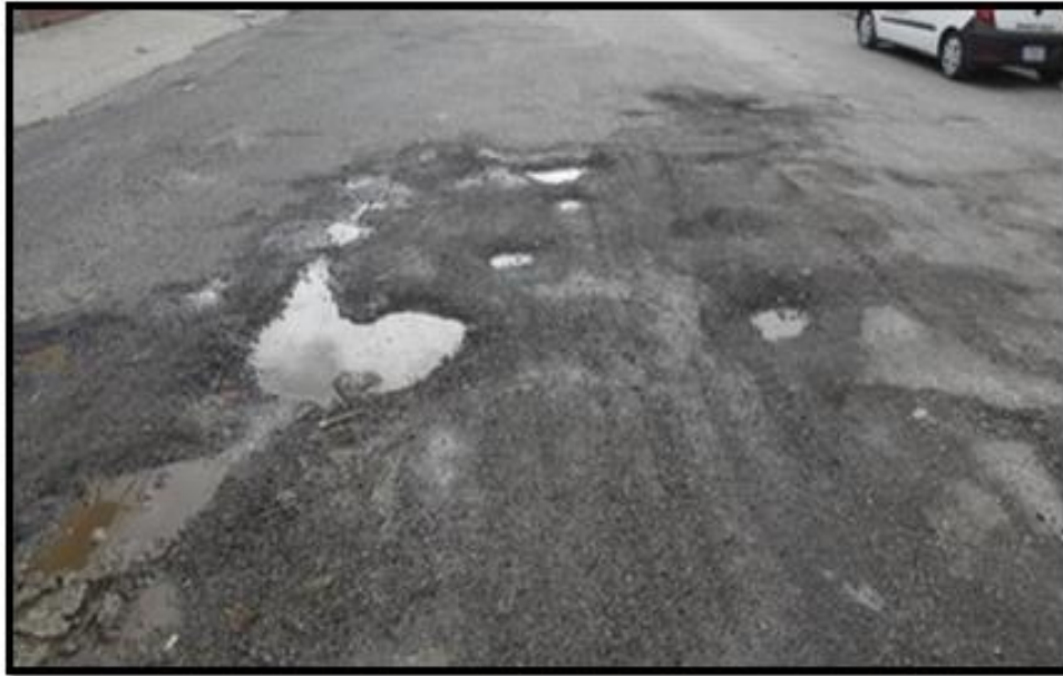
Vista del tramo en mal estado de las calles