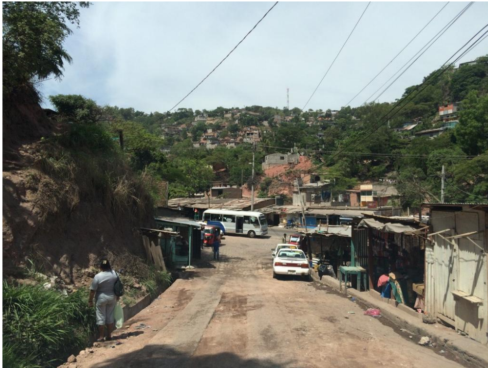
VISTA PANORAMICA DEL INICIO DEL PROYECTO