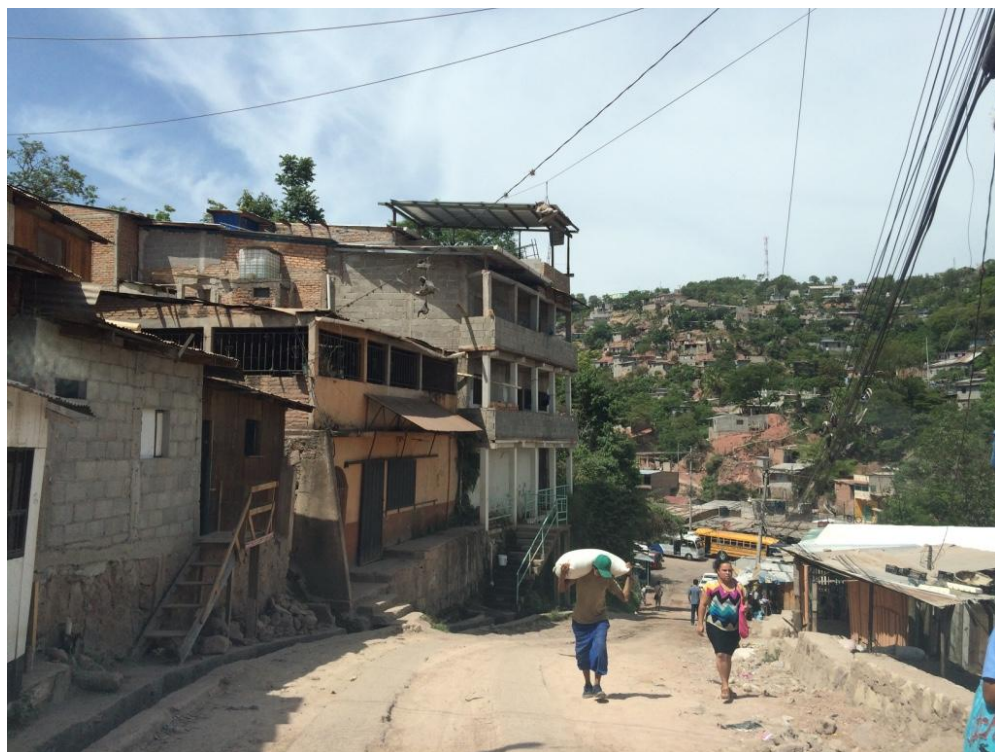
VISTA PANORÁMICA DE TRAMO A PAVIMENTAR