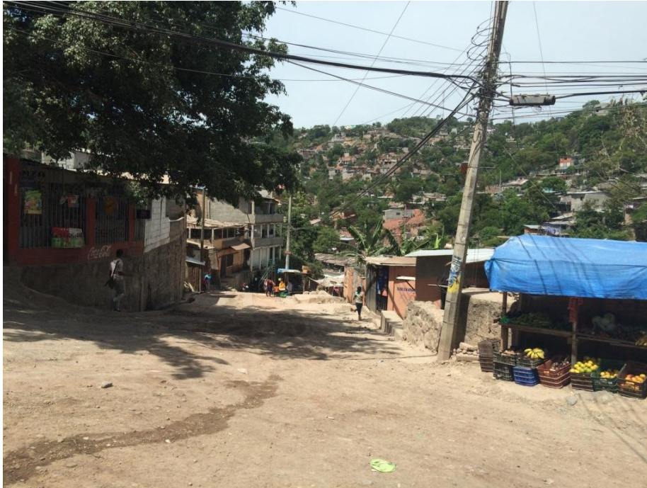
VISTA PANORÁMICA DE TRAMO A PAVIMENTAR