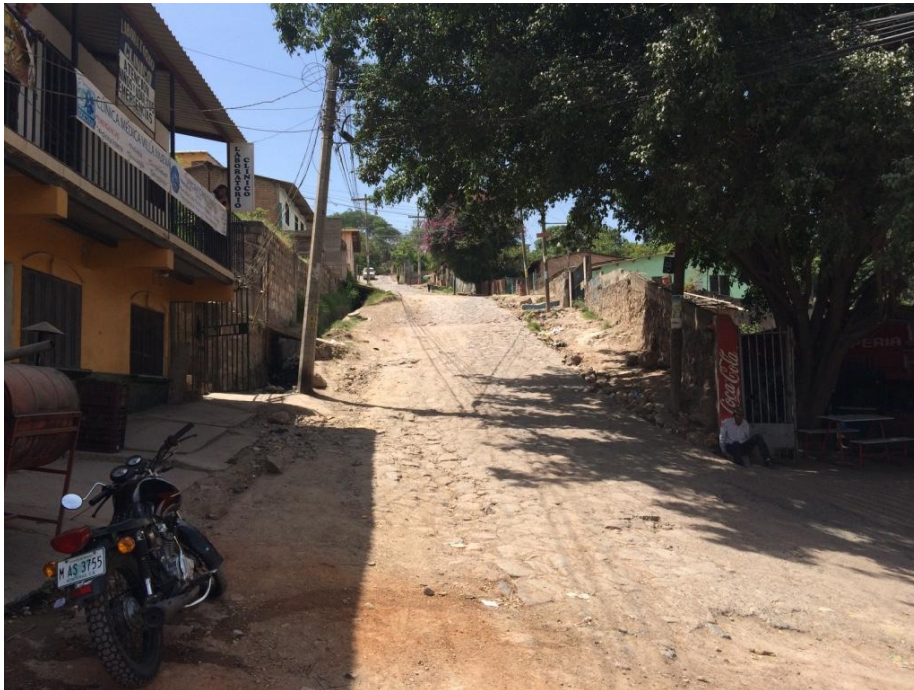
VISTA HACIA EL FINAL DEL PROYECTO