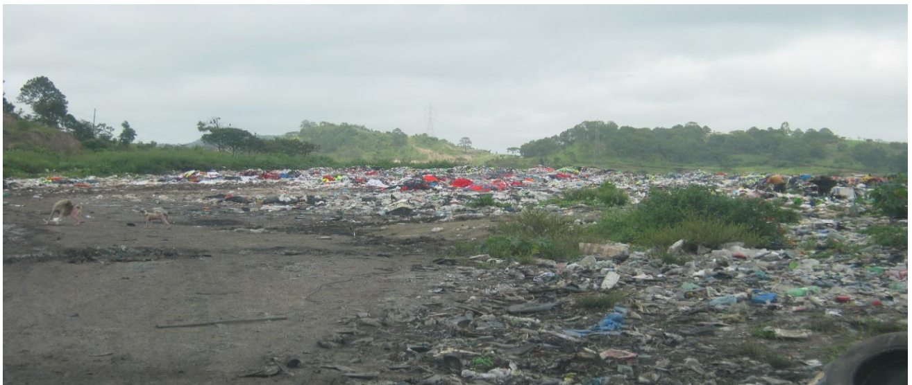
Vista de la parte alta del terreno sanitario