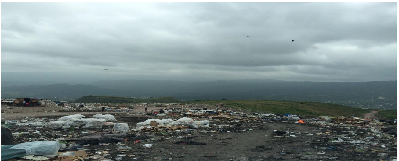
Vista del terreno donde se le da mantenimiento a los desechos