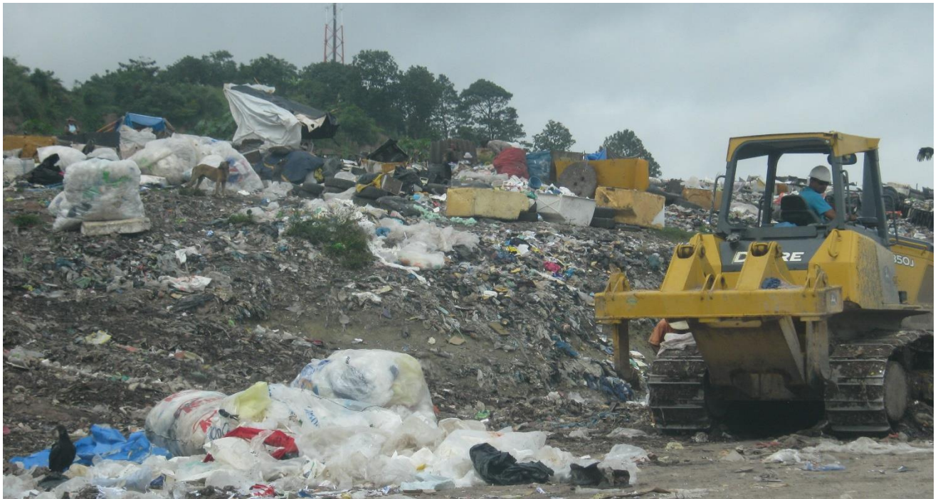
Vista panorámica de equipo pesado trabajando con los desechos solidos