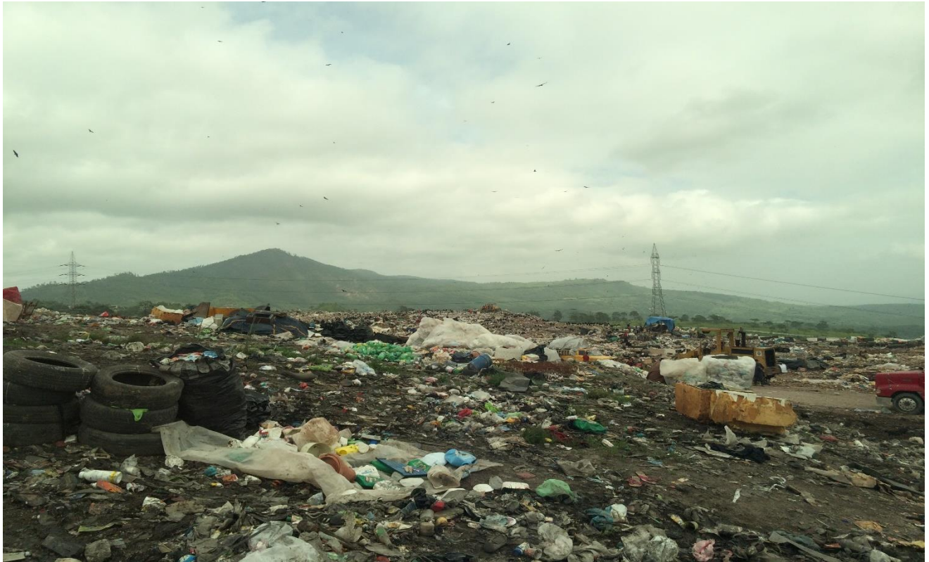
Otra panorámica de la parte alta del relleno sanitario