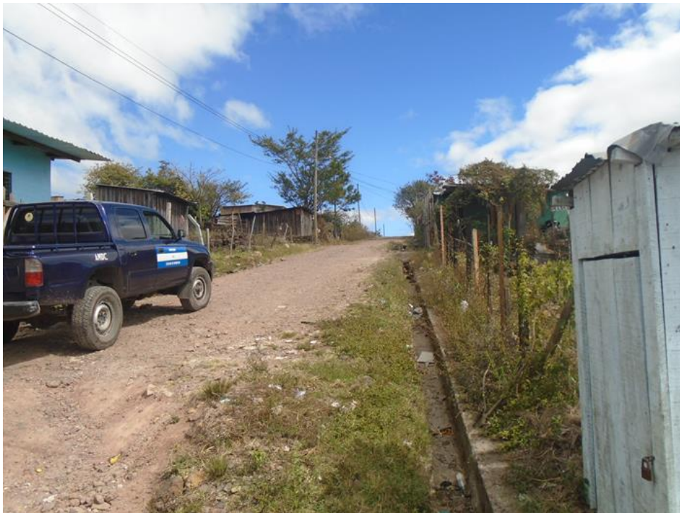
Vista de otro tramo de calle a conformar y balastar