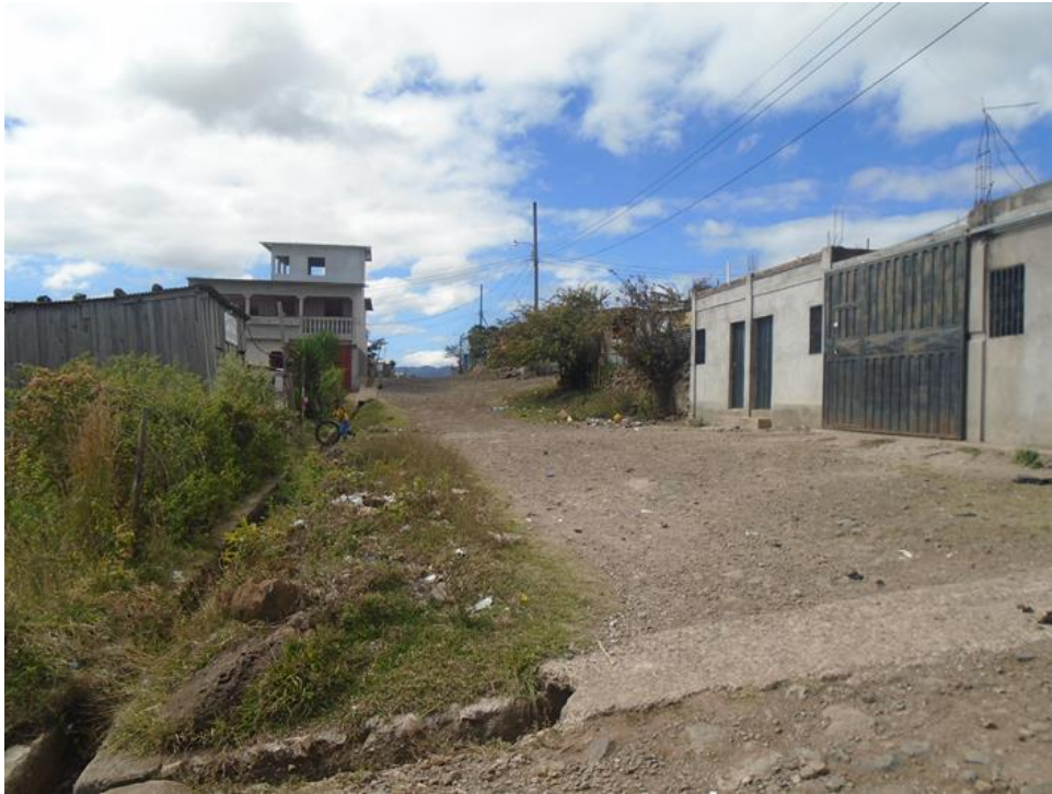
Condiciones actuales de una de las calles a conformar y balastar

Proyecto: Conformación, balastado y construcción de huellas en col. Altos de La Laguna Código: 1587