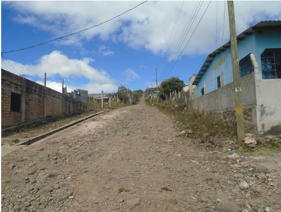
Condiciones actuales de la calle principal donde se construirán huellas

Proyecto: Conformación, balastado y construcción de huellas en col. Altos de La Laguna Código: 1587