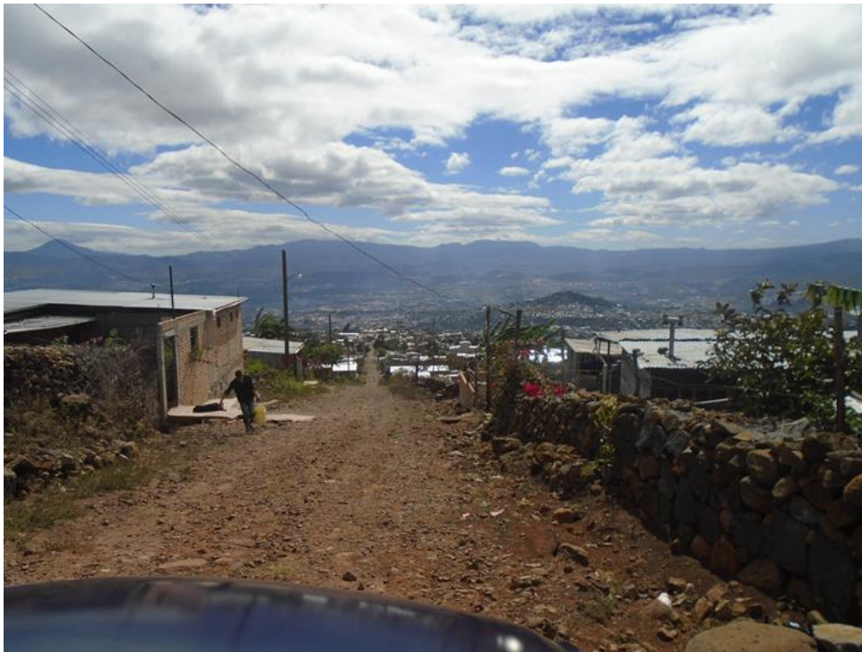
Vista general de la calle principal que muestra las malas condiciones en que se encuentra