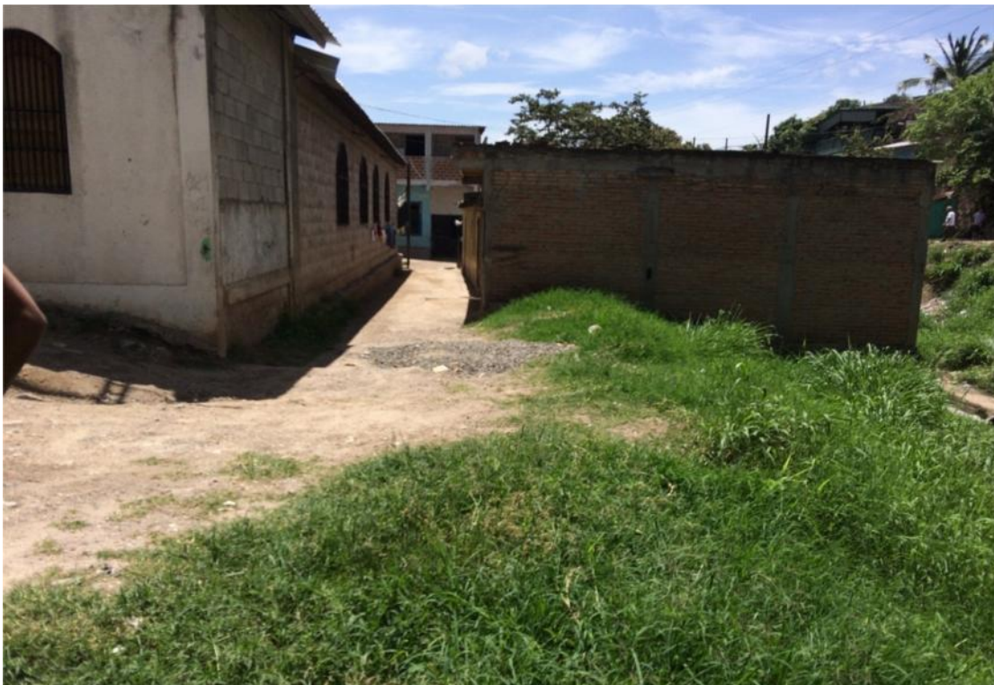
UBICACIÓN DE MURO Y FINAL DE PAVIMENTACION TRAMO 1