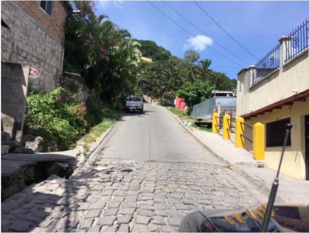
INICIO DE TRAMO 2 DE PAVIMENTACION