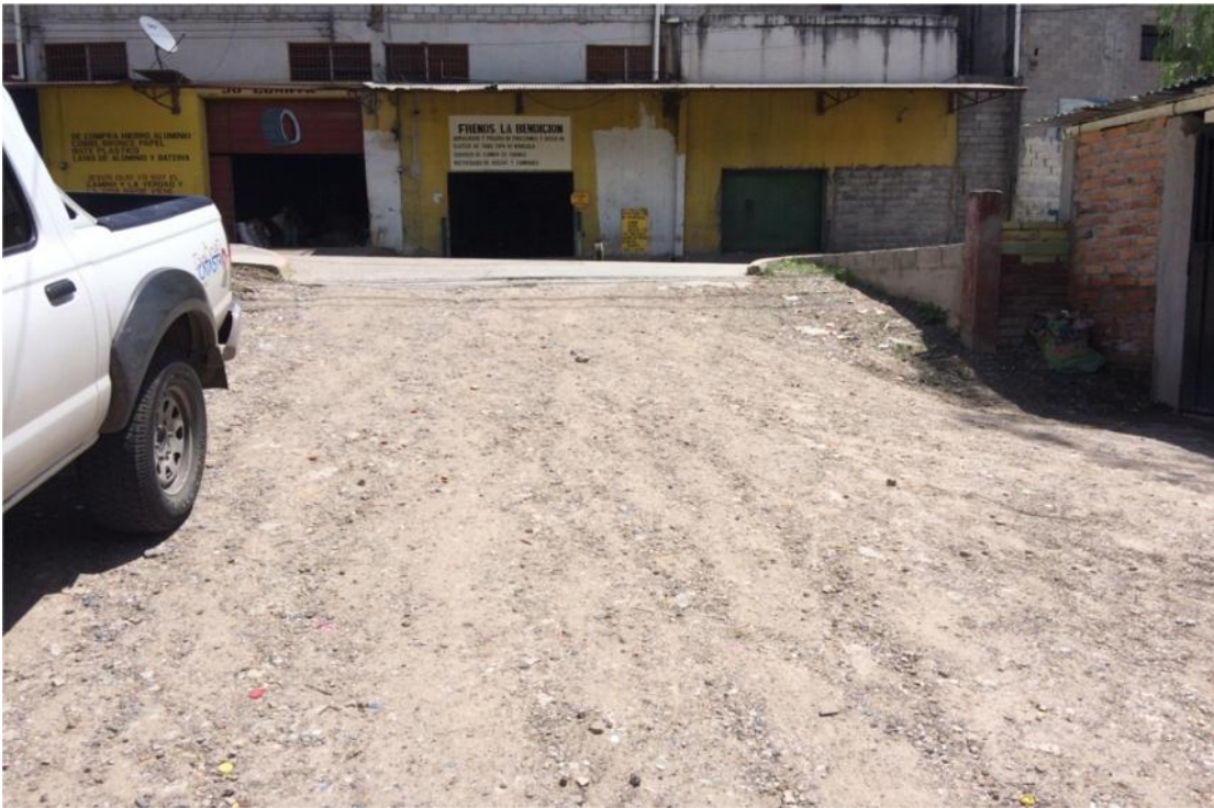
INICIO DE TRAMO 1 DE PAVIMENTACION