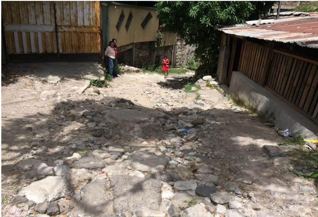
CUNETA Y PAVIMENTACION DE CALLE TRAMO 3