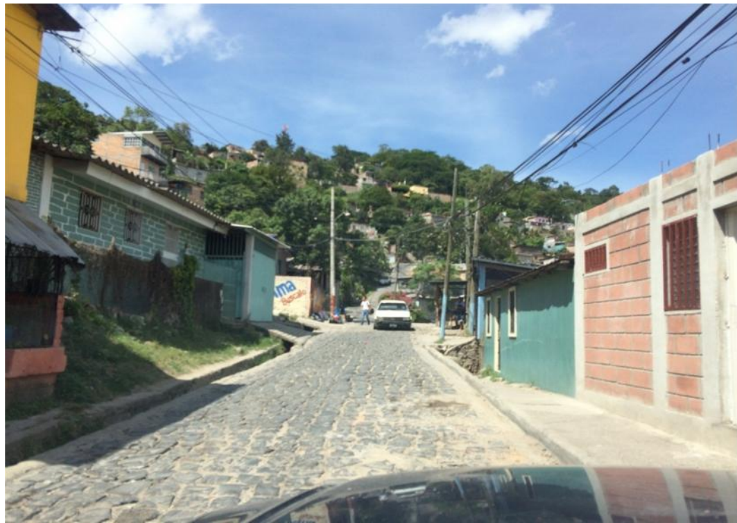
REPARACION DE EMPEDRADO TRAMO 2