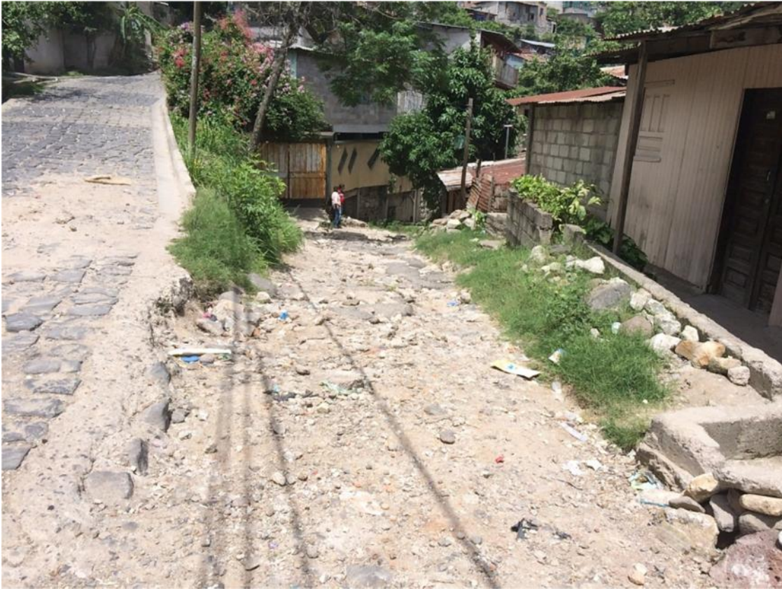
INICIO DE PAVIMENTACION TRAMO 3