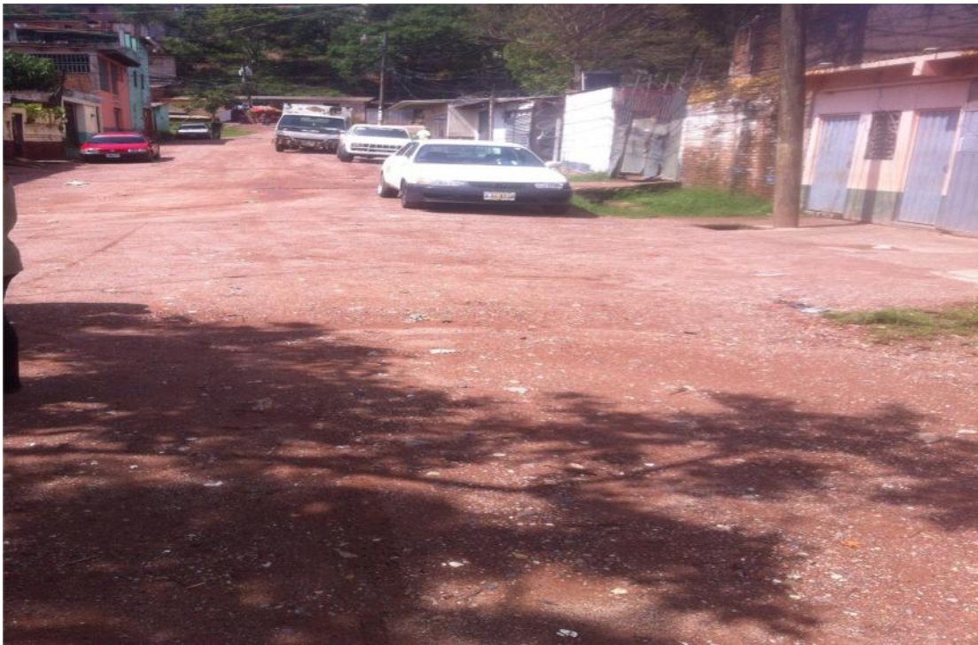
INICIO DE PAVIMENTACION DE CALLE