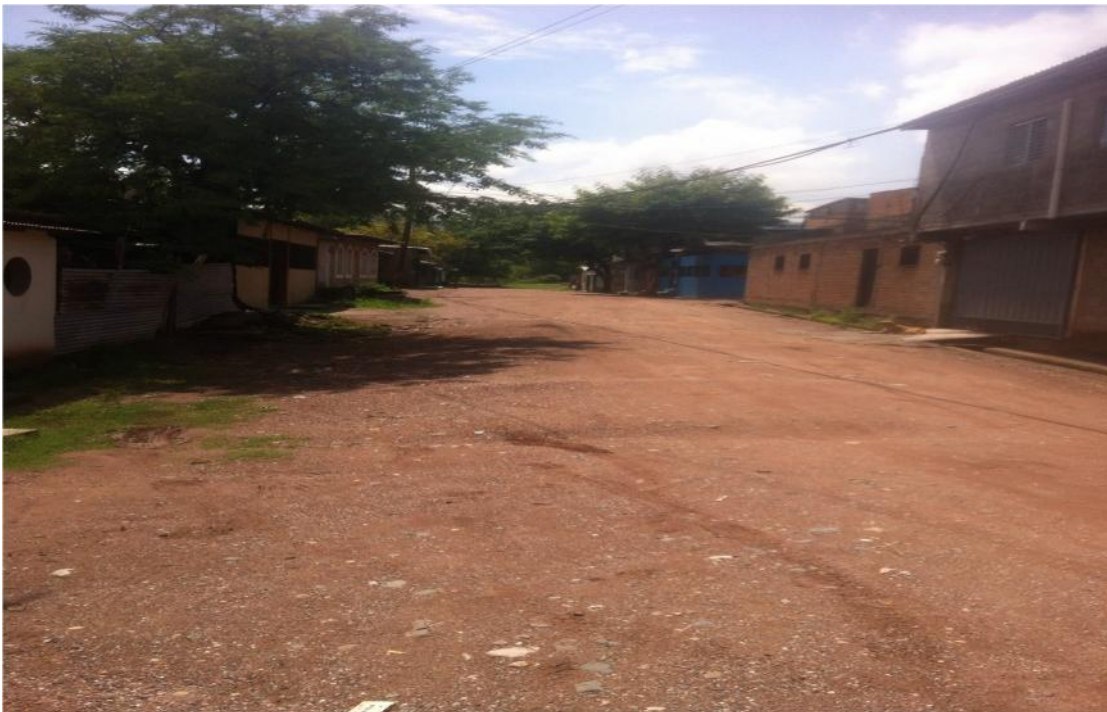
VISTA PANORAMICA DE CALLE A PAVIMENTAR