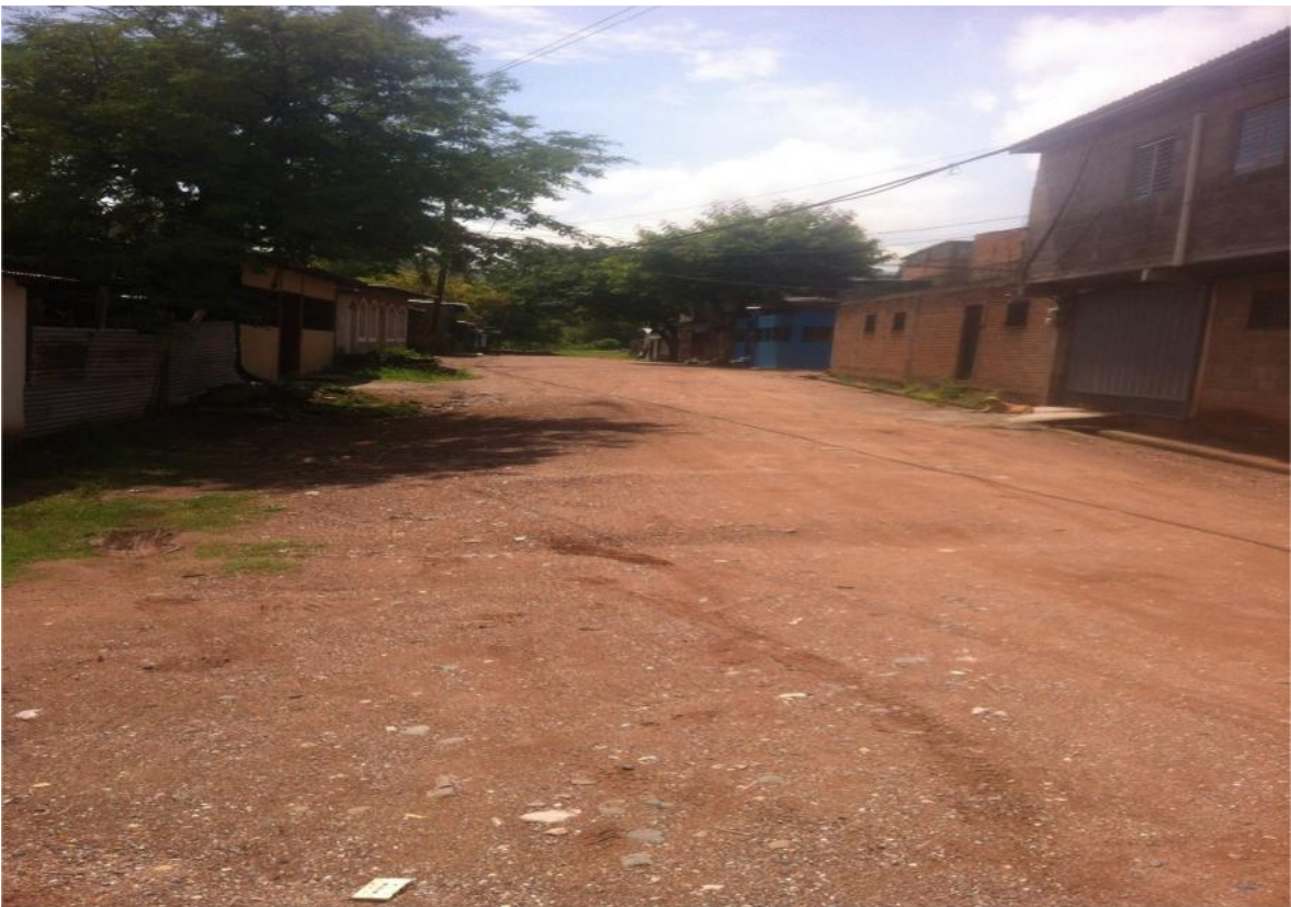
FINAL DE CALLE A PAVIMENTAR