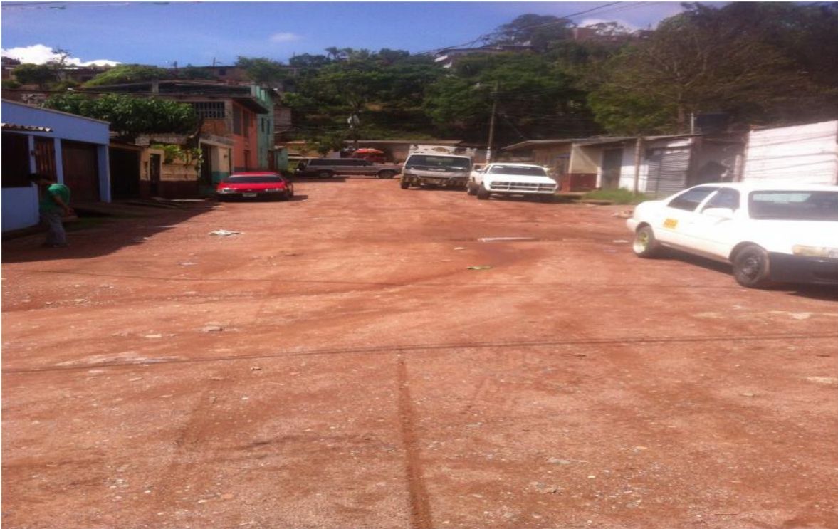
TRAMO A PAVIMENTAR EN COL. MONTERREY NORTE