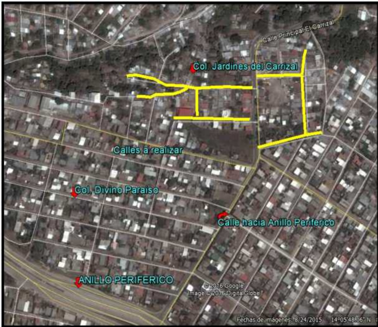
Ubicación del Proyecto