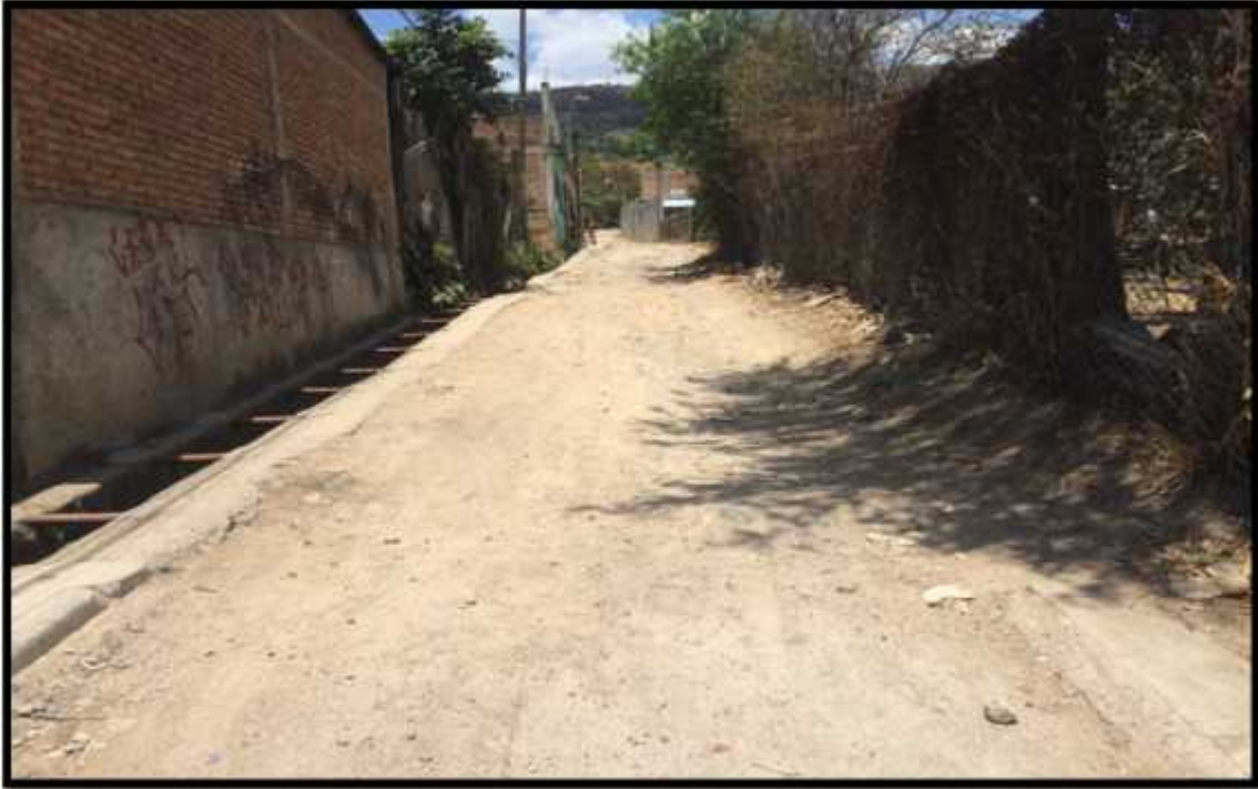
Vista panorámica del tramo a pavimentar