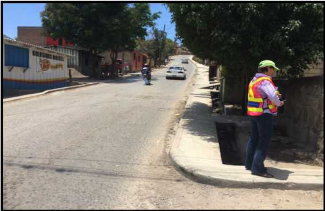
Fotografía mostrando el empalme entre la calle a pavimentar y la principal que conduce hacia el cementerio Divino Paraíso.