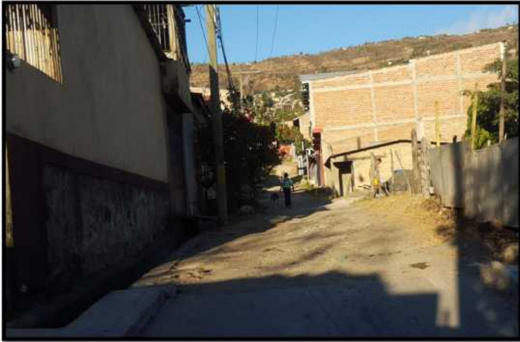
Vista de otra Calle a Pavimentar