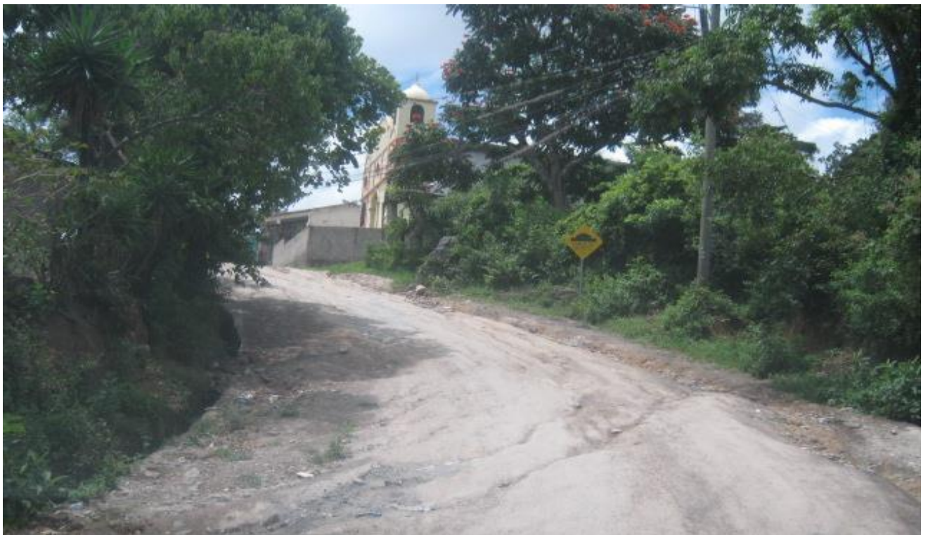
Final de calle