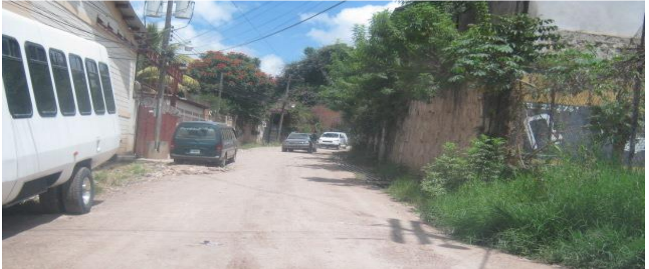
Inicio de calle donde se realizará el balastado