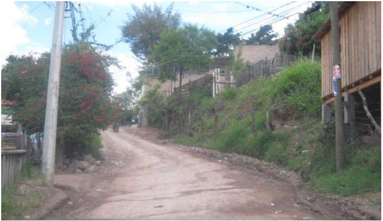
Tramo de calle donde se realizará balastado