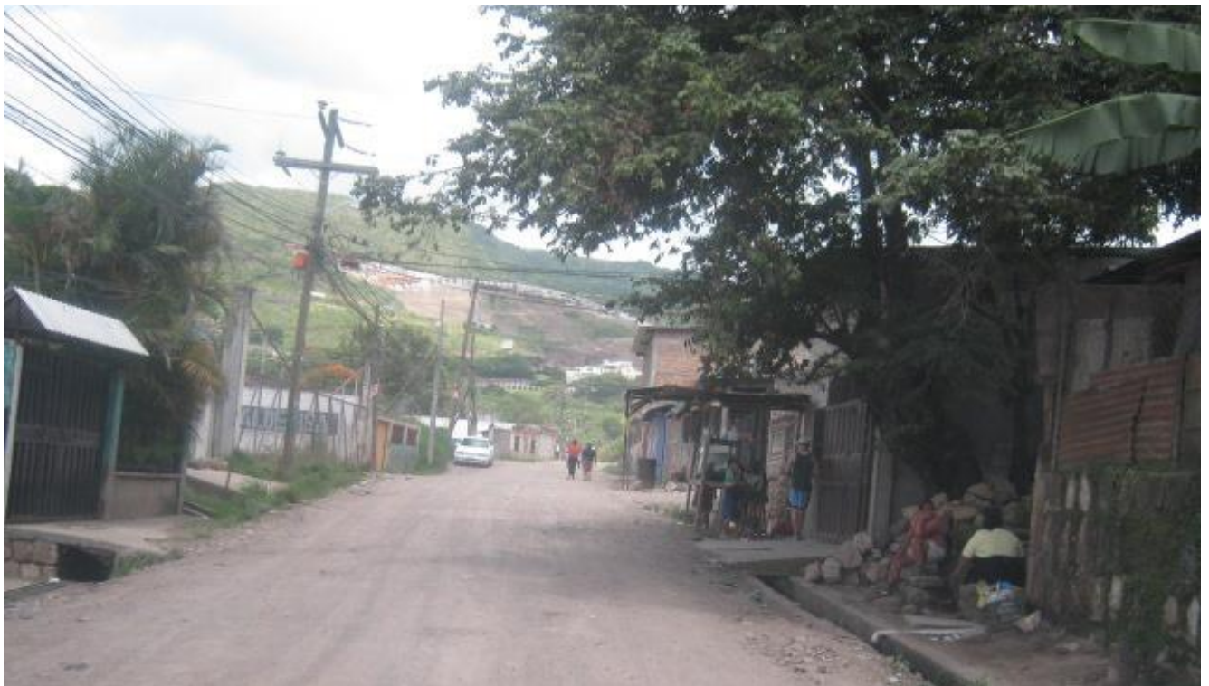
Panoramica de calle donde se realizará balastado