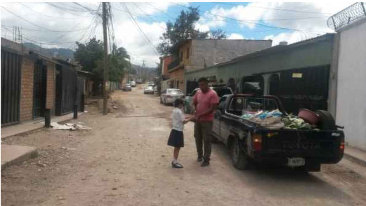
Vista de tramo a reparar