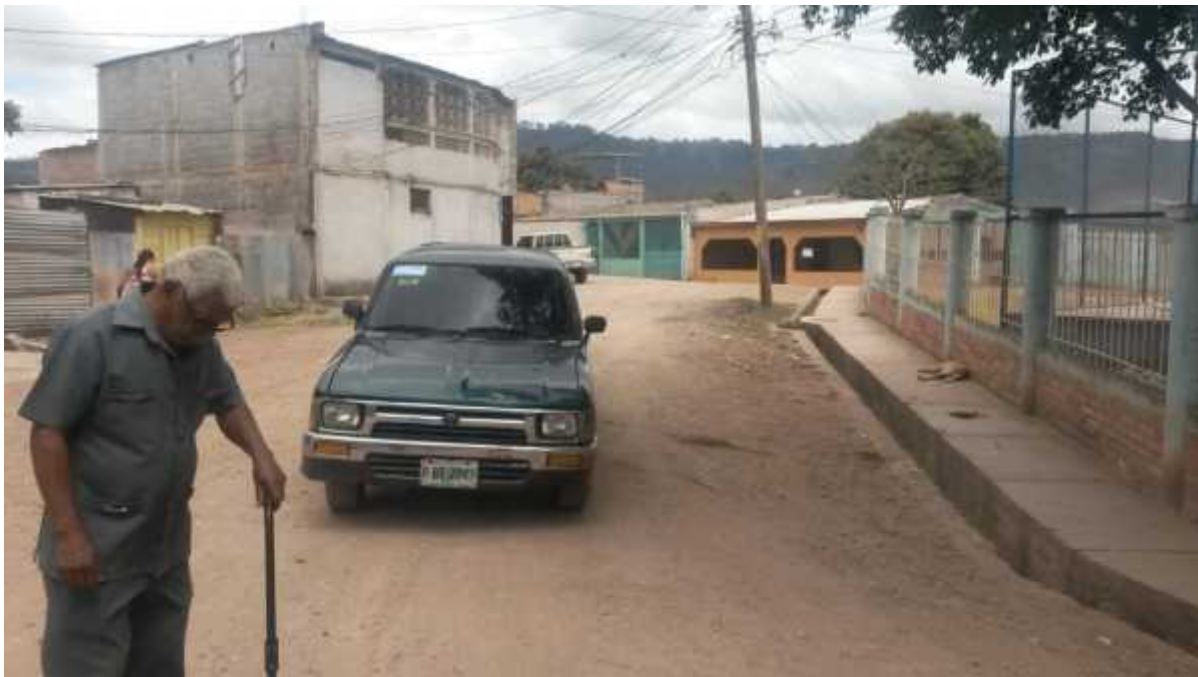
Vista final de la calle