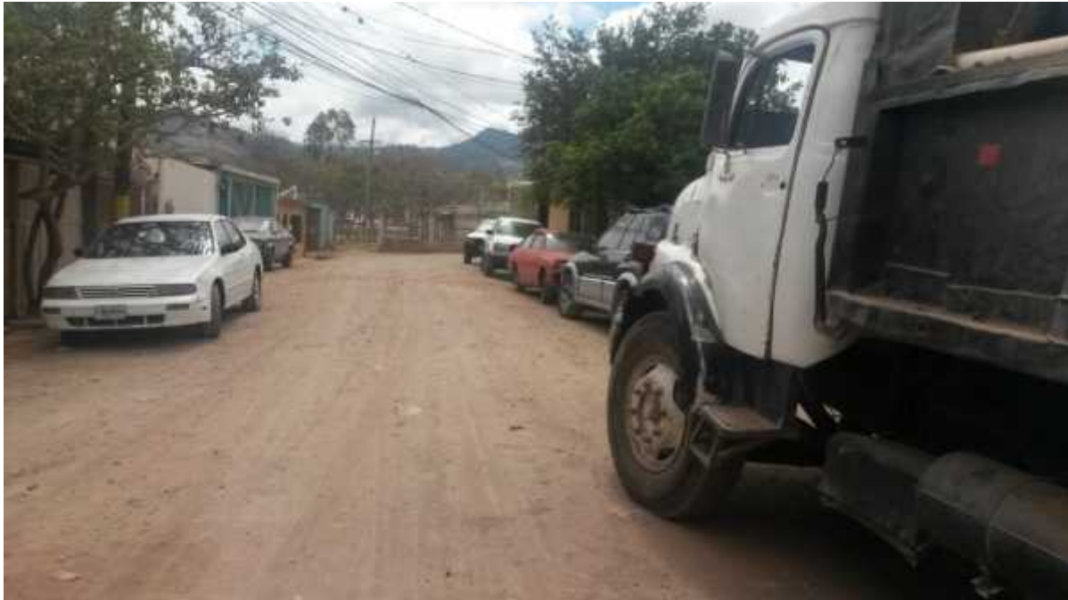
Vista panorámica de tramo a reparar