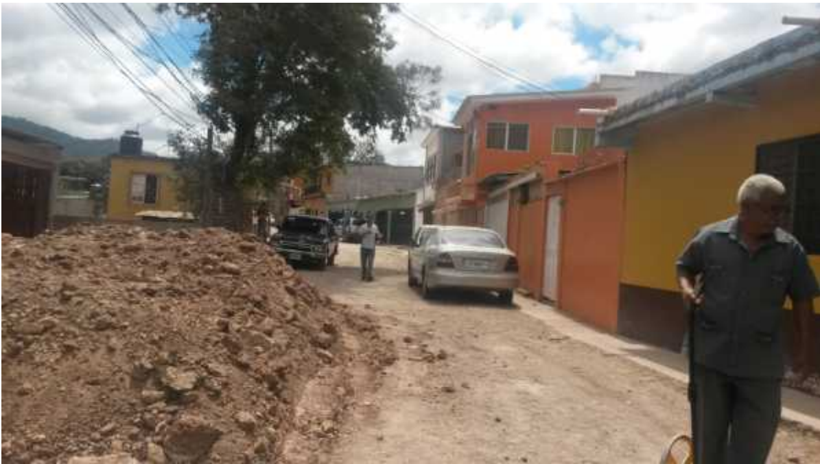
Vista del inicio de calle a reparar