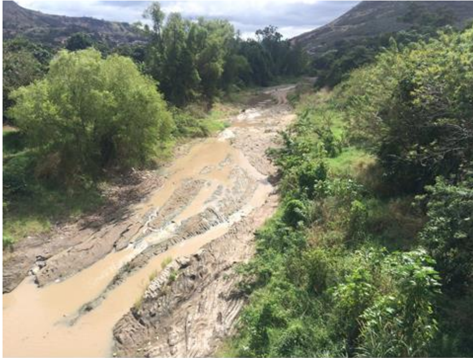
VISTA DEL TRAMO A CANALIZAR, EN SECTOR GERMANIA