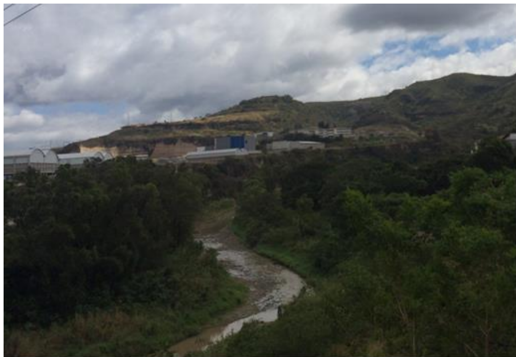
CONDICIONES DEL CAUCE EN ZONA DEL ANILLO PERIFÉRICO, SECTOR COL. SATELITE