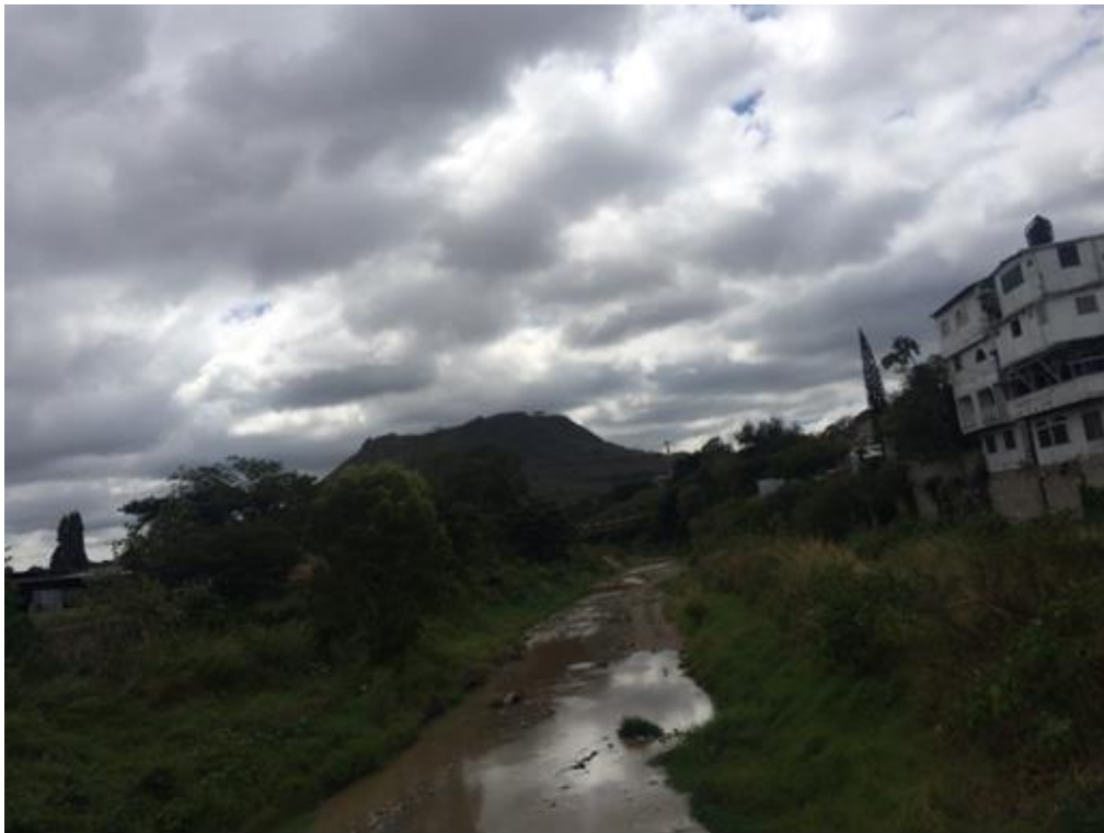
CAUCE DEL RIO GRANDE EN ZONA DE LOARQUE