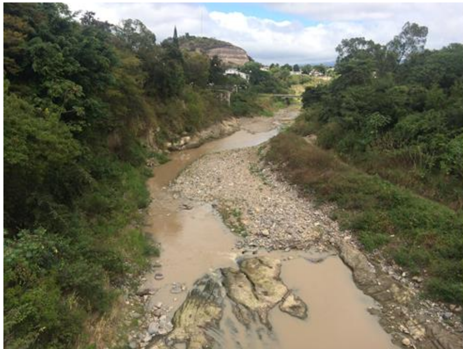
CONDICIONES ACTUALES DEL RIO GRANDE EN ZONA DE GERMANIA