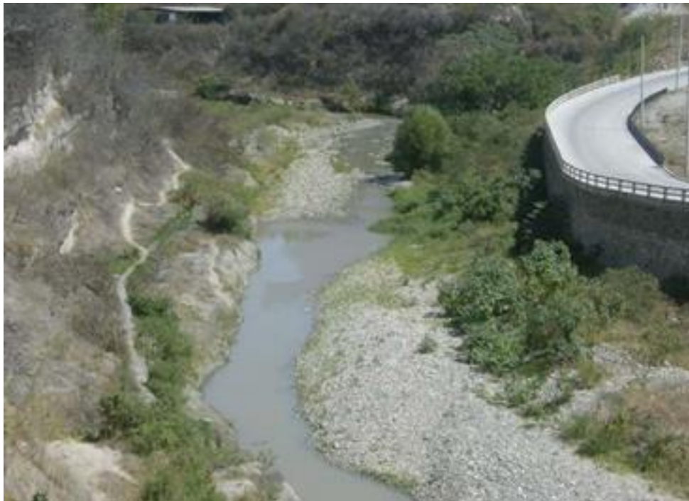
VISTA DEL TRAMO, LOCALIZADO EN COL. LAS BRISAS