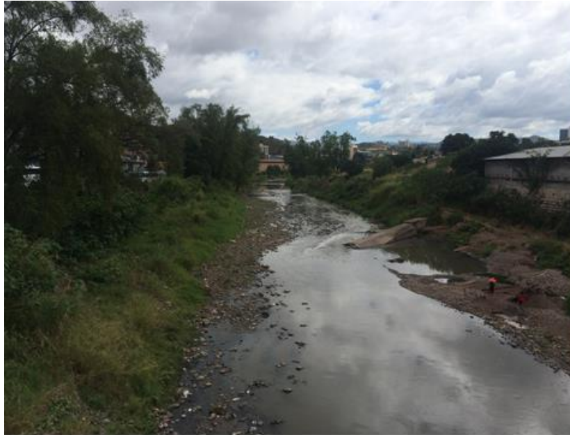
VISTA DEL TRAMO A CANALIZAR, COL. EL PRADO