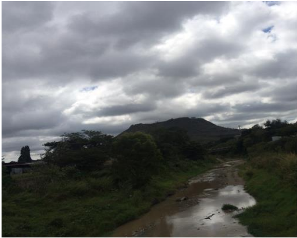
VISTA DEL TRAMO, LOCALIZADO EN COL. LA VEGA