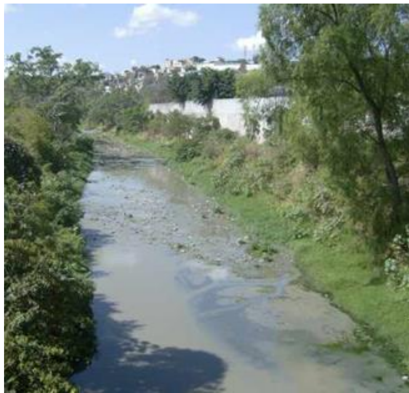
VISTA DEL TRAMO, LOCALIZADO EN COL. PRADO