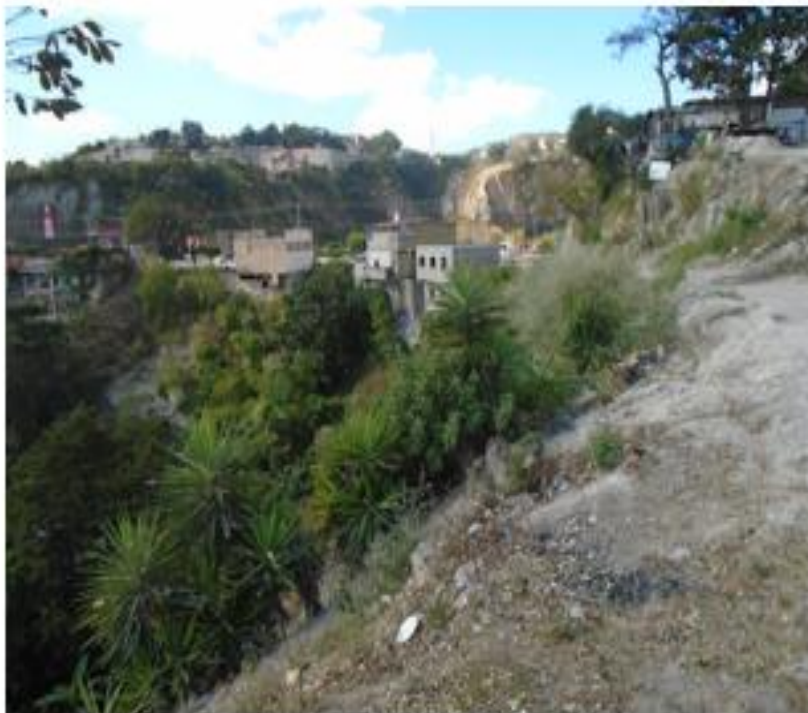
SE OBSERVA TALUD DONDE SE CONSTRUIRA MURO DE MAMPOSTERIA EN TRAMO 1