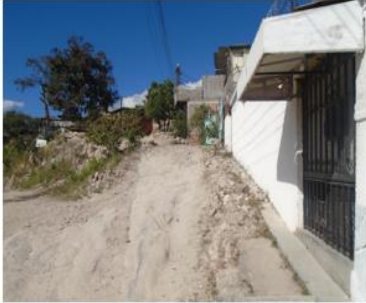
CONDICIONES ACTUALES DE TRAMO 2, DONDE SE CONSTRUIRA UN TRAMO DE MURO EN LA ZONA DEL TALUD EXISTENTE