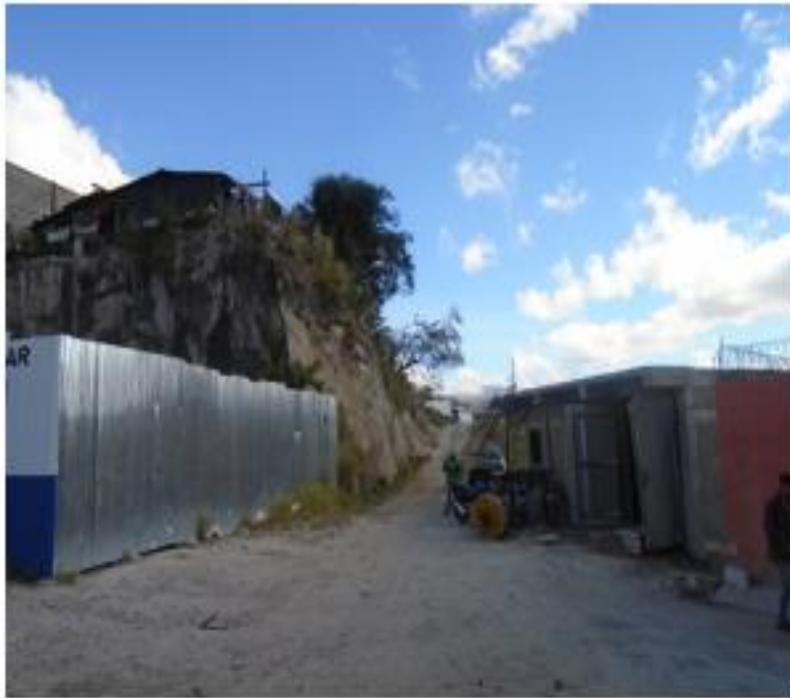
INICIO DEL TRAMO 1 QUE CONECTA CON BOULEVARD FUERZAS ARMADAS

Proyecto: Pavimentación de calle con concreto hidráulico, col. Santa Cecilia, calle secundaria Código: 1539