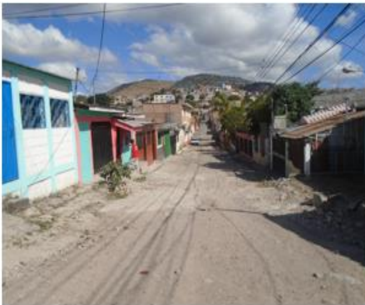
SE OBSERVAN LAS MALAS CONDICIONES DEL TRAMO 3, EL CUAL SE CONECTARA A PAVIMENTO EXISTENTE.