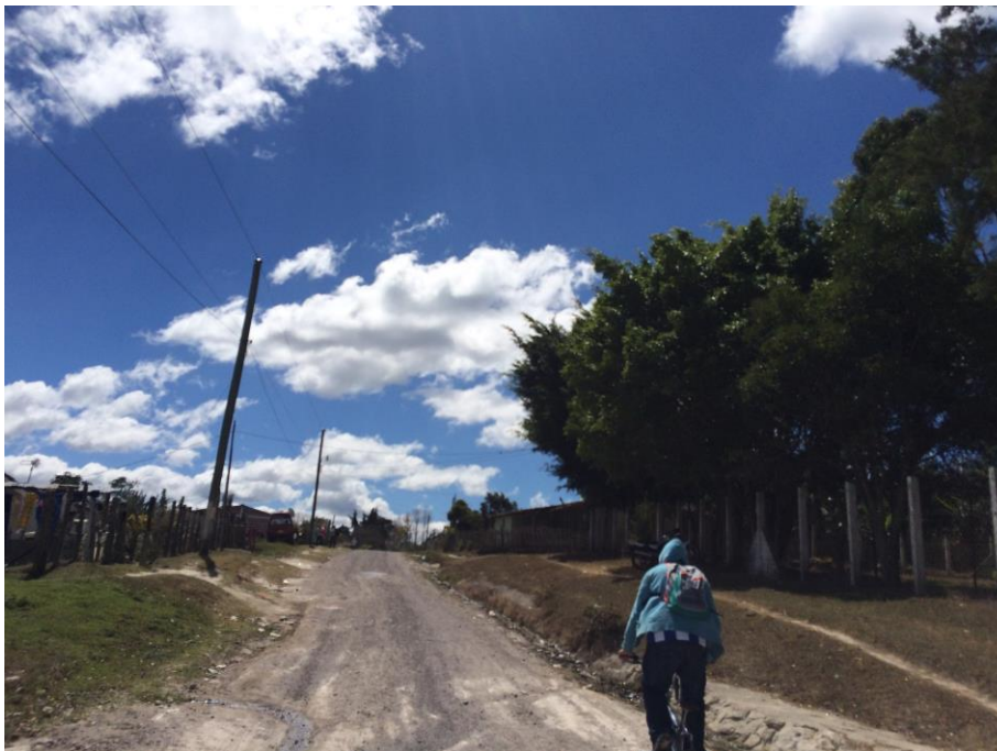
VISTA DE TRAMO DE CALLE A REPARAR