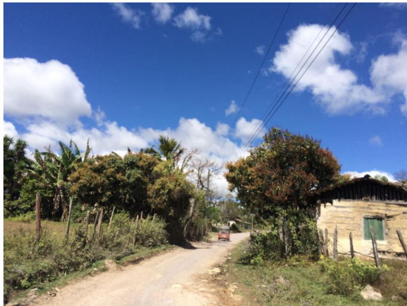
VISTA DE CALLE EN ALDEA SAN FRANCISCO DE SOROGUARA