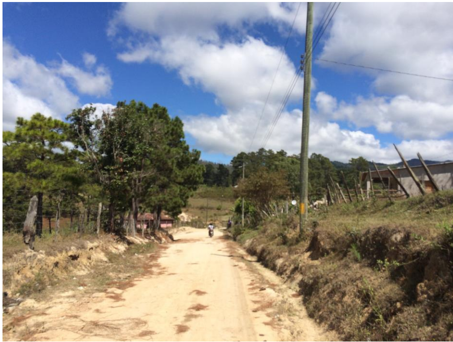
VISTA DE TRAMO A BALASTAR

Proyecto: Conformación y balastado de calles, aldea San Francisco de Soroguara, calles internas Código: 2110