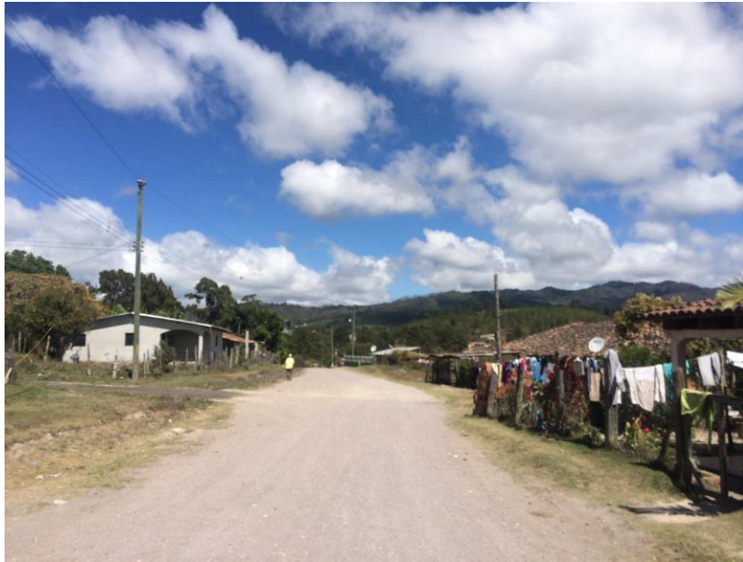
VISTA DE LAS CONDICIONES EN QUE SE ENCUENTRA LA CALLE A BALASTAR

Proyecto: Conformación y balastado de calles, aldea San Francisco de Soroguara, calles internas Código: 2110