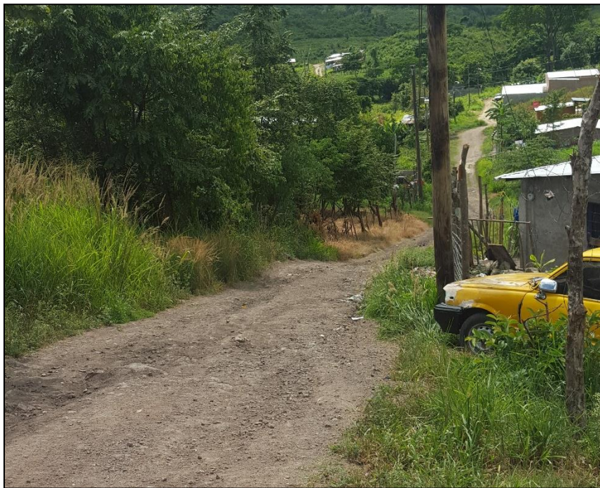
Foto 2. Vista panorámica de calle a reparar