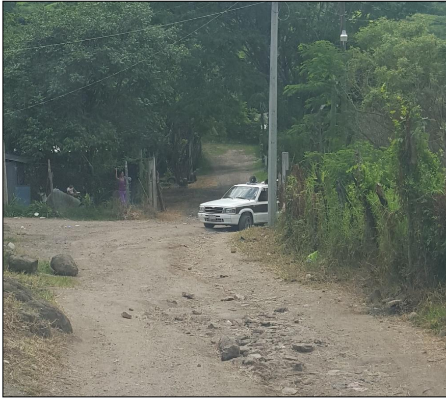
Foto 1. Inicio de proyecto de conformación y balastado