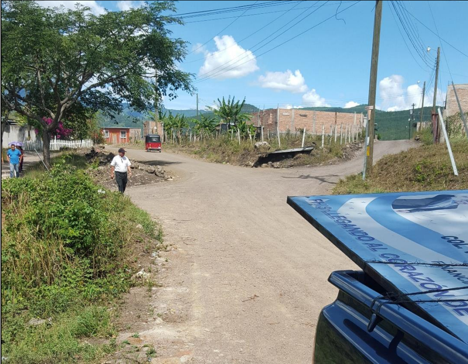
Foto 3. Tramo donde se construirán las cunetas