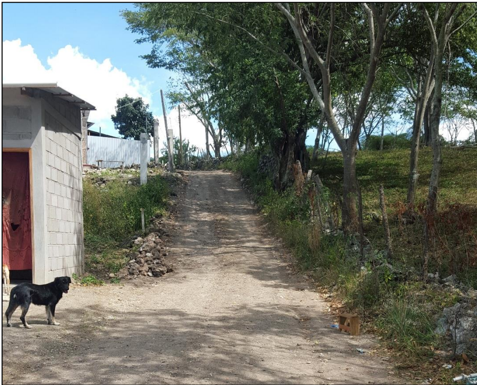
Foto 4. Vista panorámica donde se construirán las cunetas