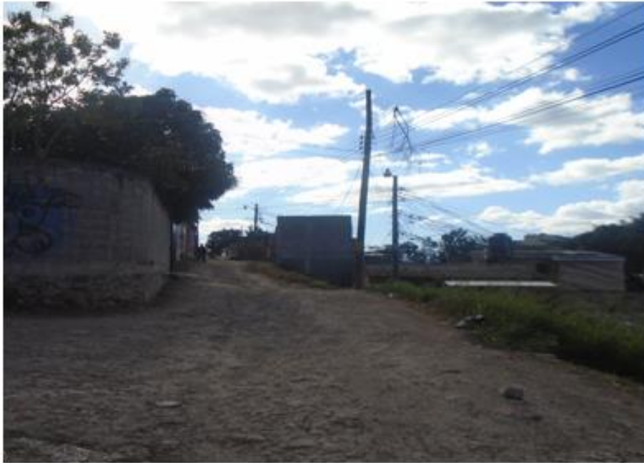
Vista de la calle a pavimentar con concreto hidráulico