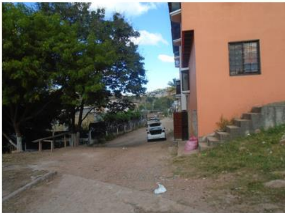
Final de la calle a pavimentar con concreto hidráulico