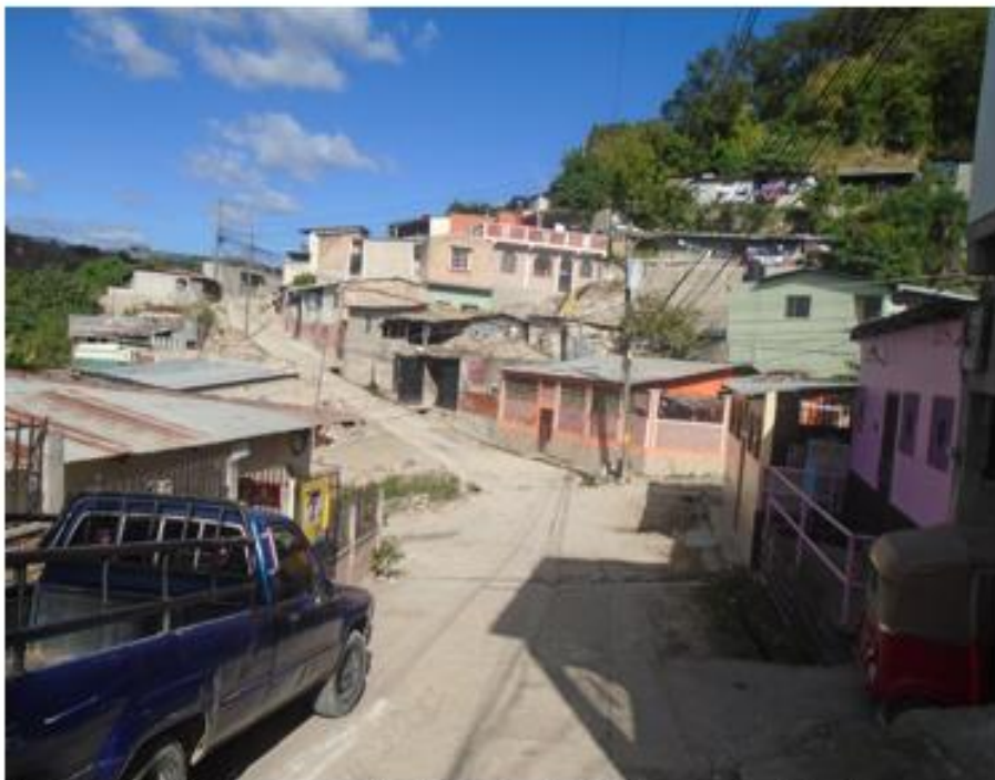
Estado actual de la calle donde se hará la demolición de elementos de concreto.