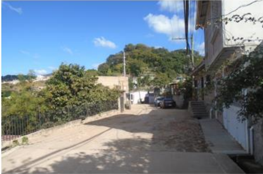
Inicio de calle a pavimentar con concreto hidráulico.