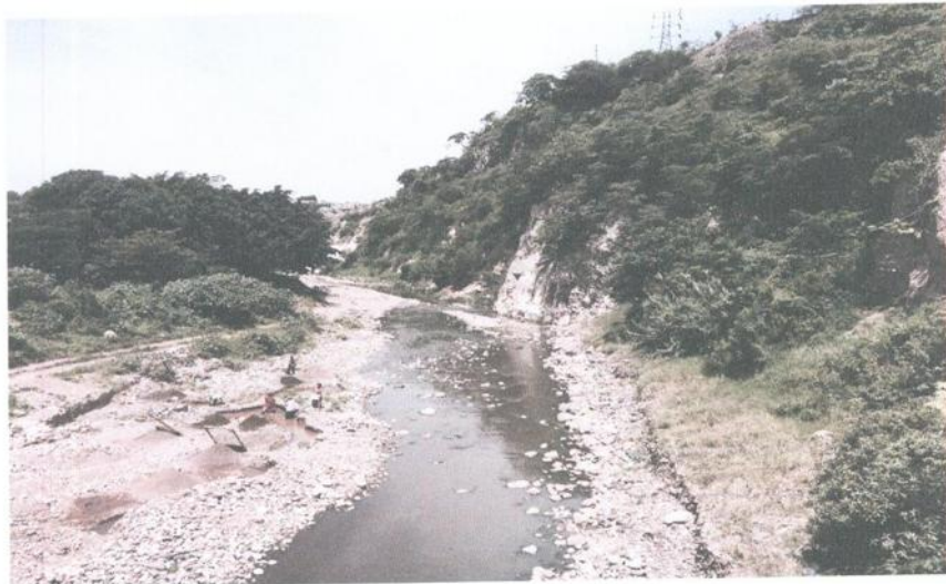
VISTA DEL FINAL DEL TRAMO A CANALIZAR