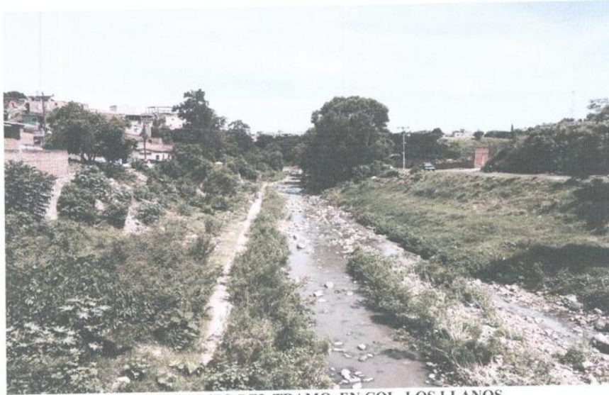
VISTA DEL INICIO DEL TRAMO, EN COL. LOS LLANOS.