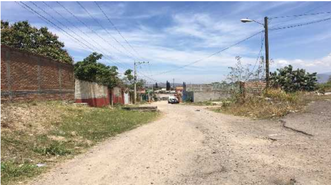
Inicio de calle a pavimentar