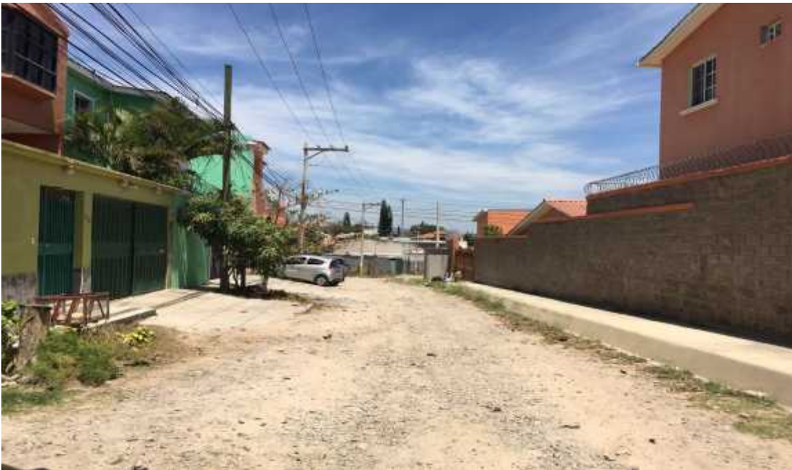
Vista panorámica de la calle