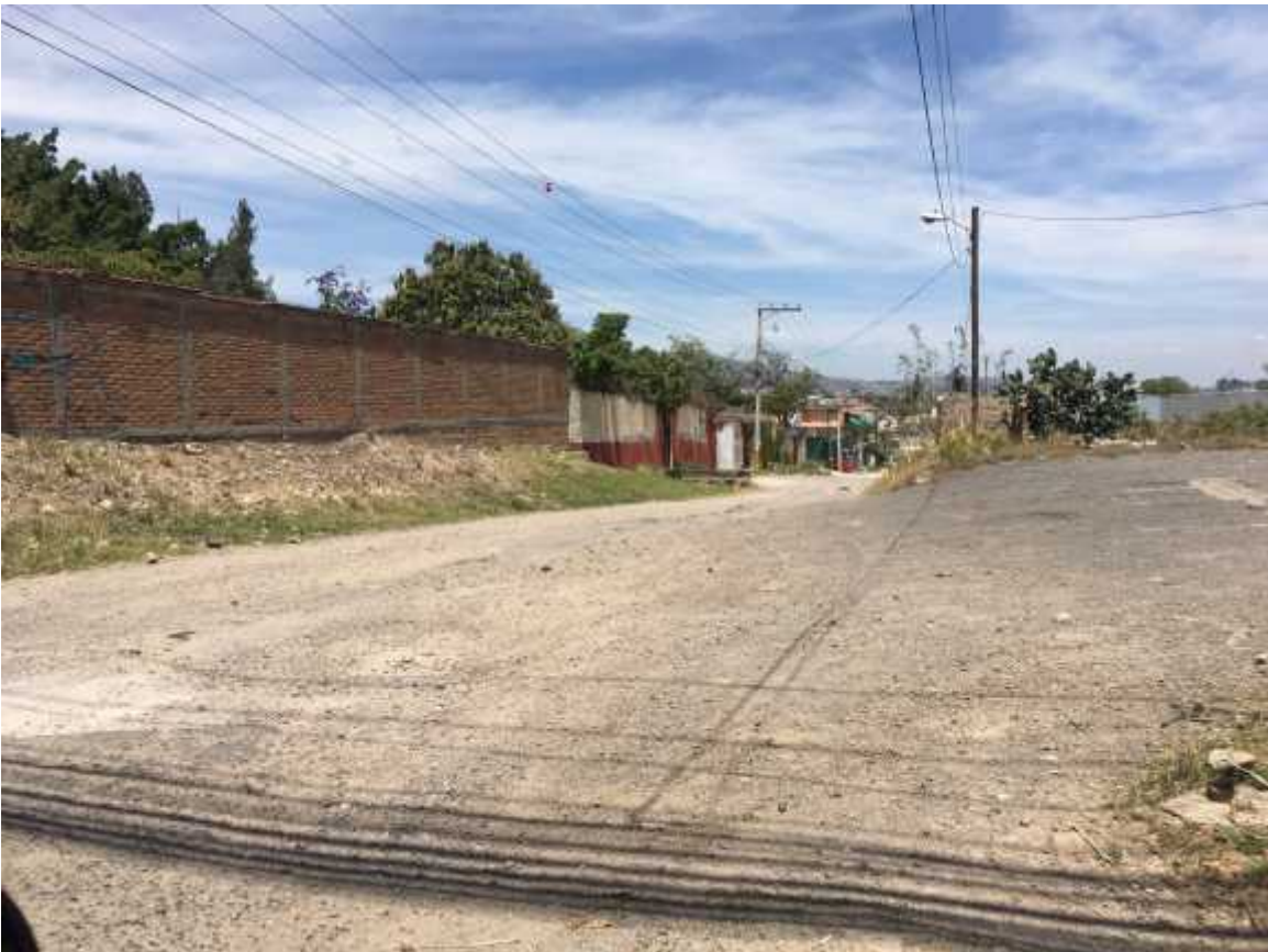
Fin de calle a pavimentar