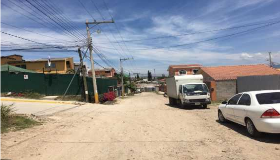
Vista de la seccion de la calle