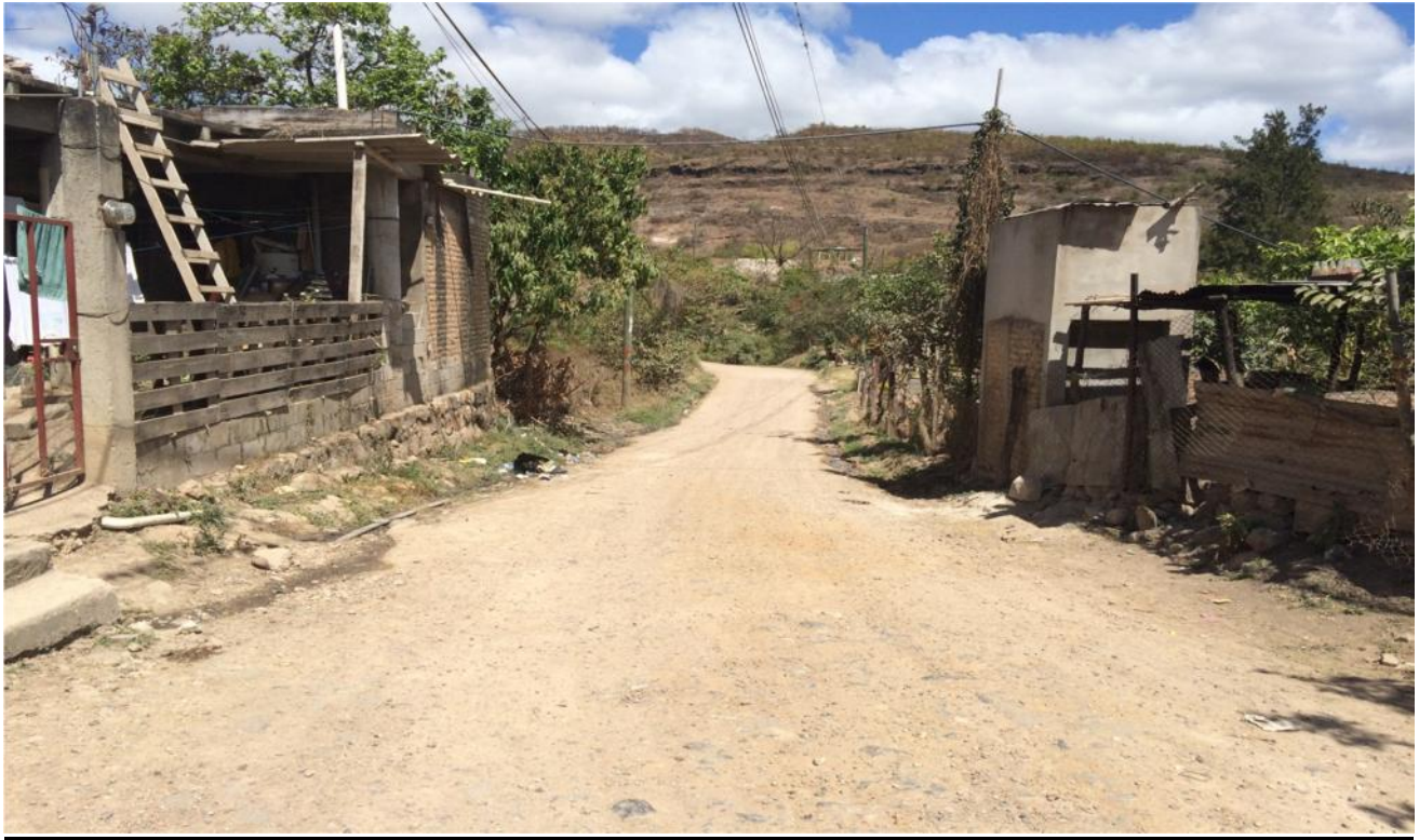
VISTA DEL INICIO DEL TRAMO REPARAR