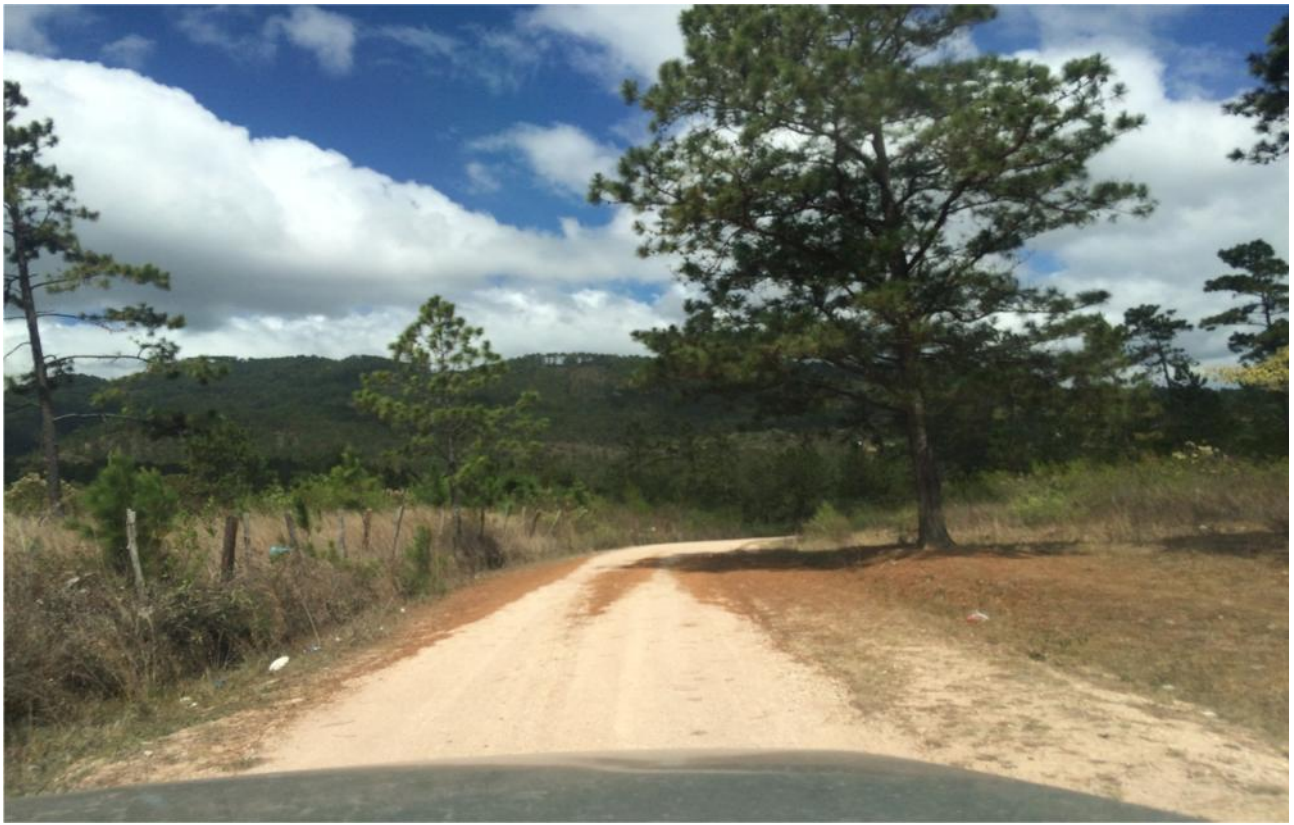
VISTA PANORAMICA DEL TRAMO, INICIOS DE ALDEA QUISCAMOTE