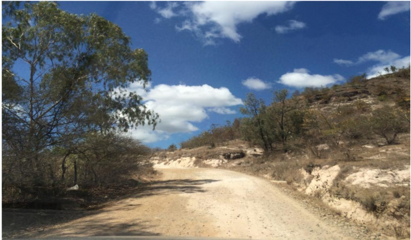
VISTA PANORAMICA DEL TRAMO, SUBIENDO HACIA ALDEA QUISCAMOTE