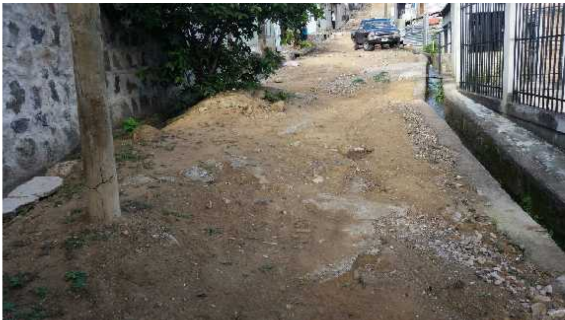
Vista del deterioro de la calle