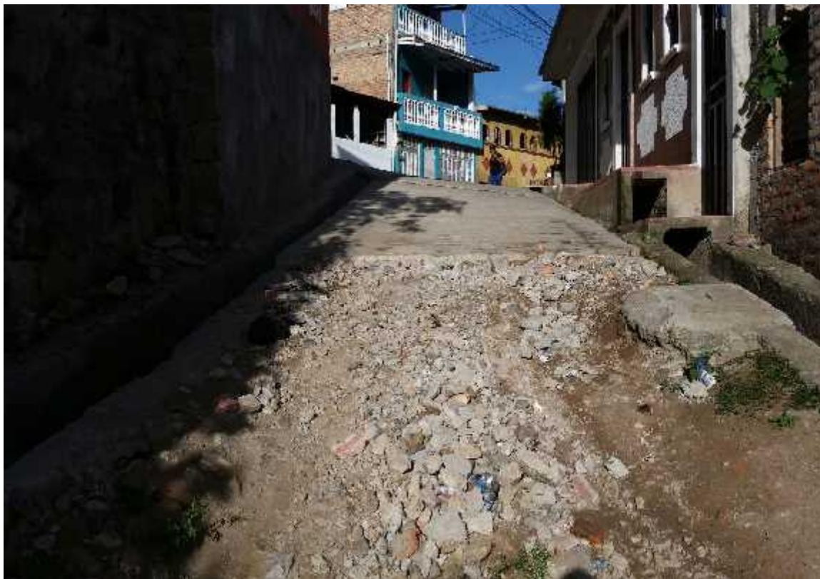
Inicio del proyecto