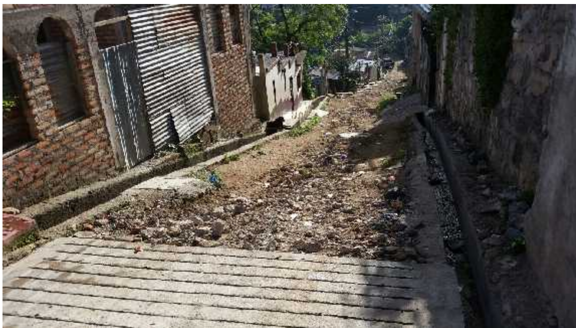
Vista panorámica de un tramo del proyecto