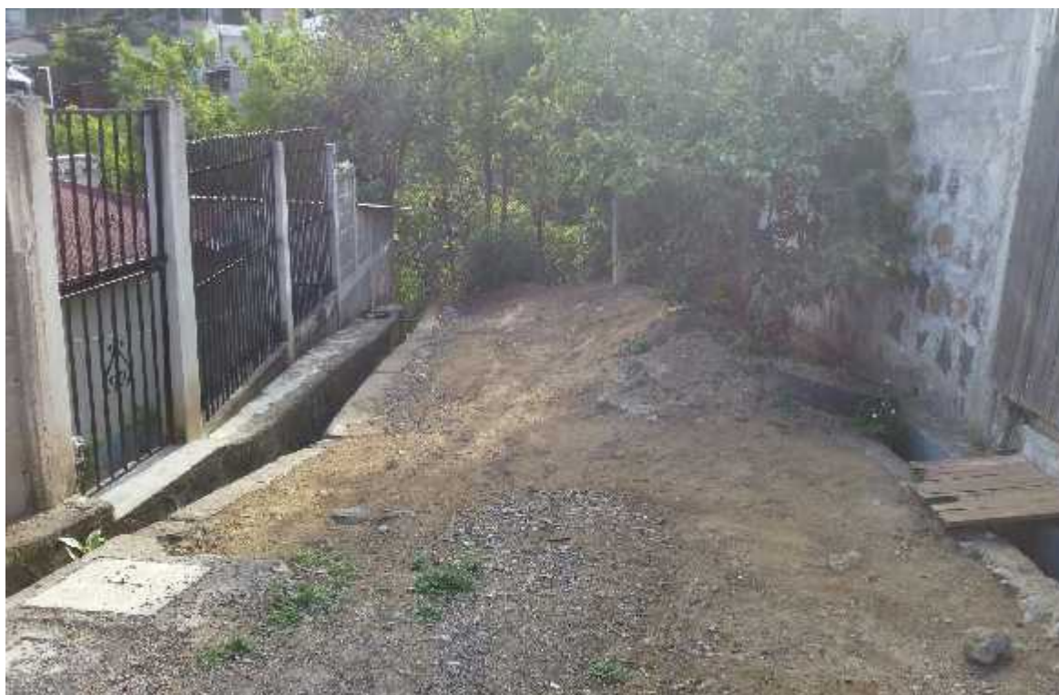
Vista al final del proyecto