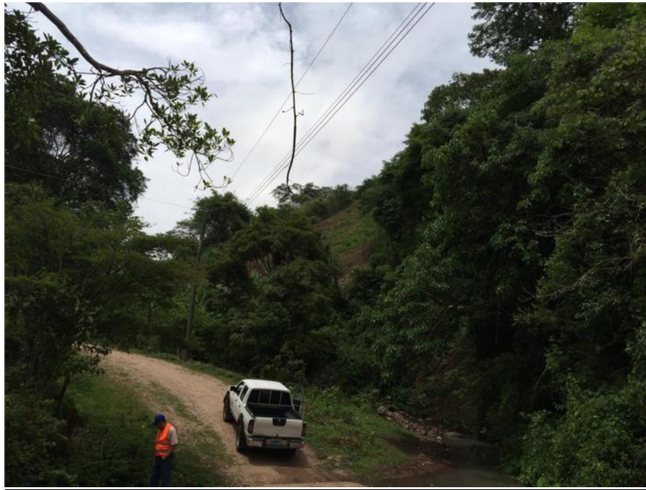
Final del proyecto en el desvío de terreros donde se ubica este rotulo