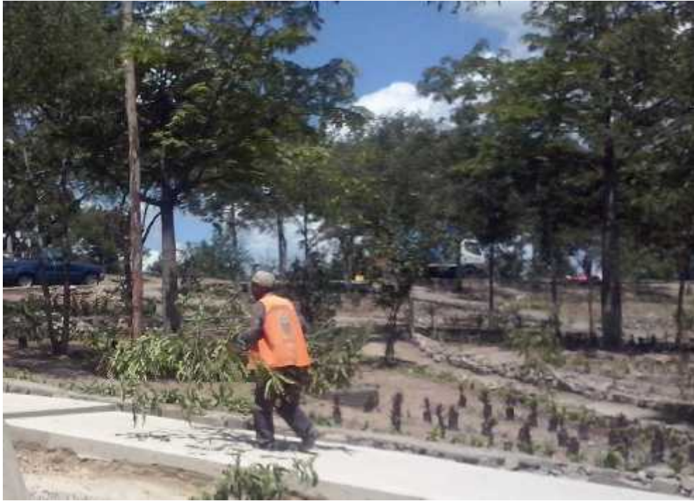
Vista de los espacios utilizados para el mural