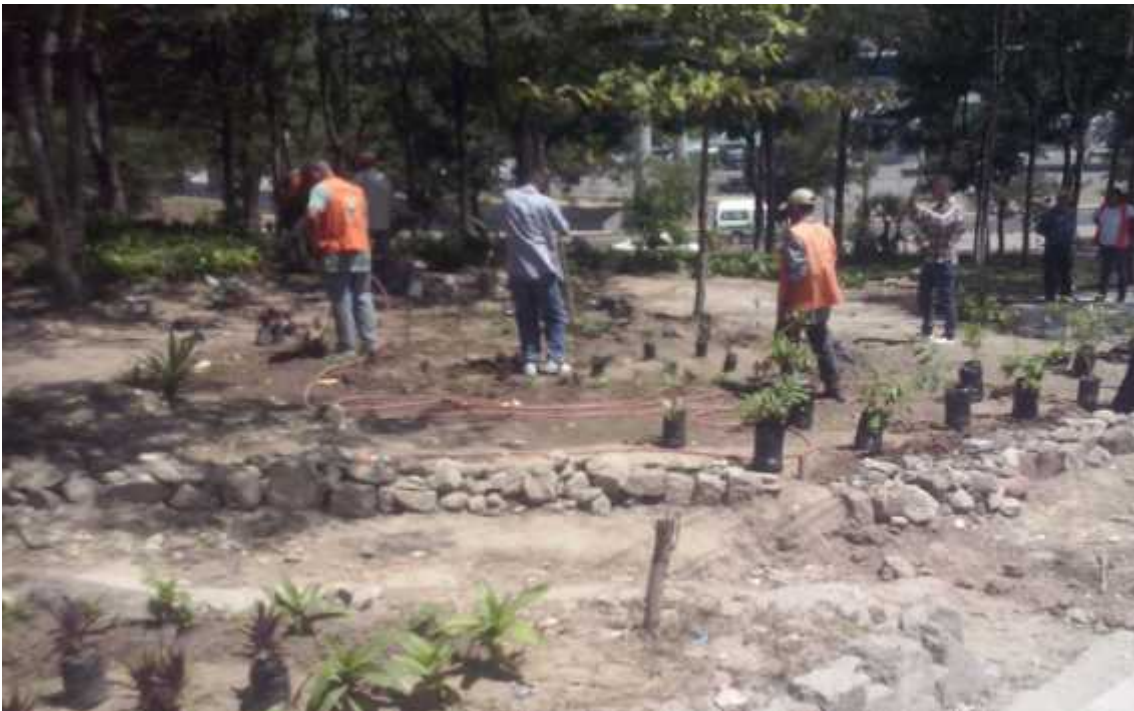
Vista frontal de área verde asignada para el mural