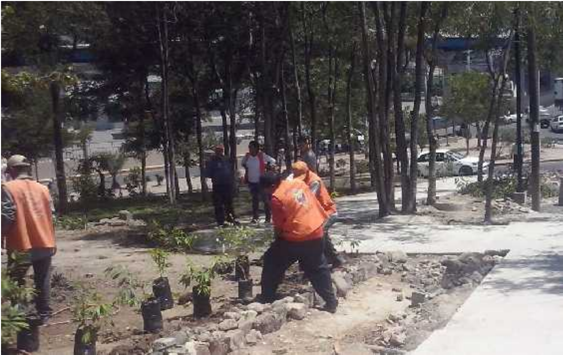
Vista del lugar asignado para el proyecto