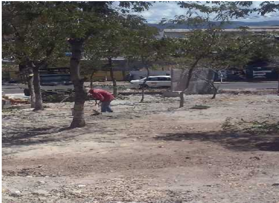
Vista posterior del lugar asignado para el proyecto