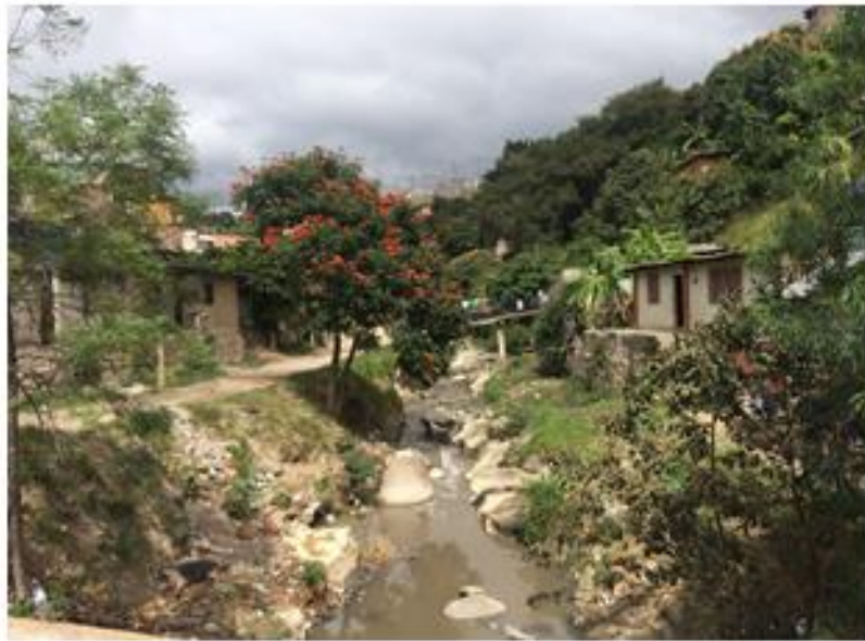
VISTA DEL TRAMO A CANALIZAR, COL. 21 DE FEBRERO