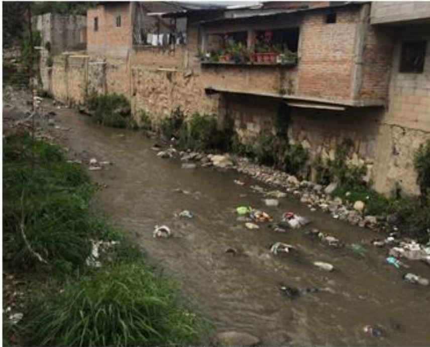
VISTA DEL TRAMO A CANALIZAR