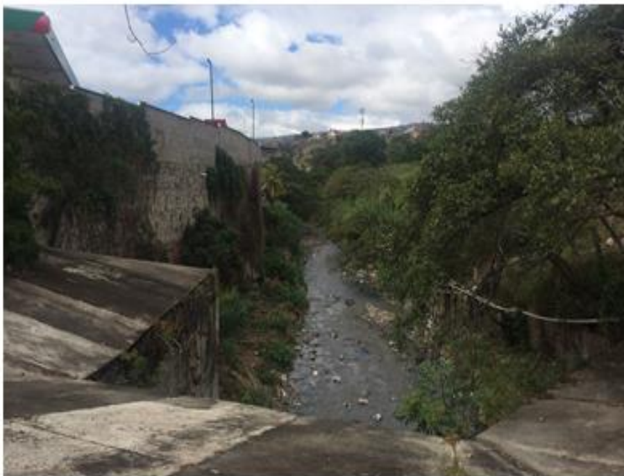
VISTA DEL TRAMO, LOCALIZADO EN EL COUNTRY CLUB EN BULEVAR FUERZAS ARMADAS