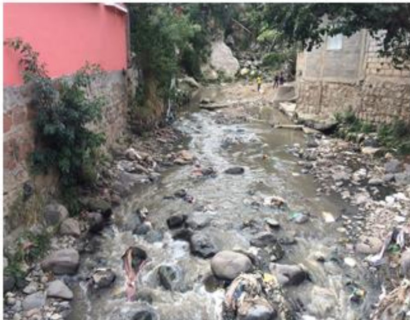
VISTA DEL TRAMO, LOCALIZADO EN COL. PRIMERO DE DICIEMBRE