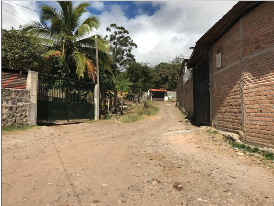
PANORAMA DE LA CALLE A PAVIMENTAR

Proyecto: Pavimentación de calle con concreto hidráulico, col. El Manantial, calle principal Código: 1522