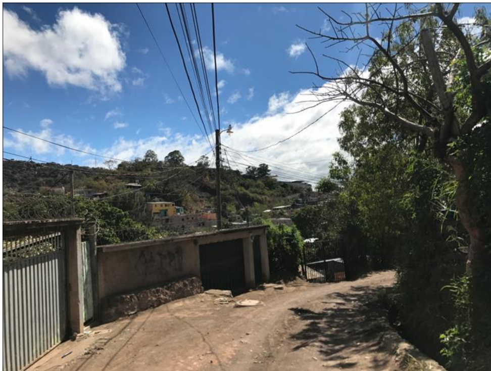
PANORAMA DE LA CALLE A PAVIMENTAR