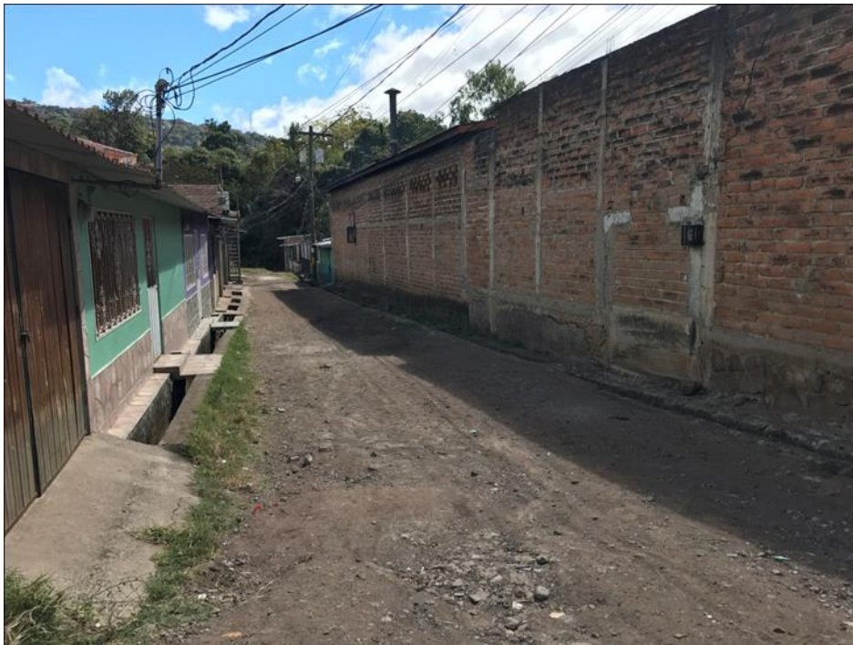
CALLE A PAVIMENTAR CON CONCRETO HIDRÁULICO