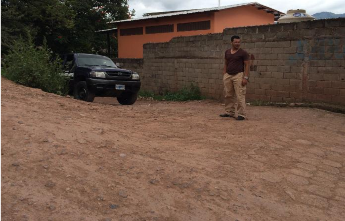
Foto 3: vista de la condicion presente de calle en la cual se hara la pavimentacion con concreto hidraulico.