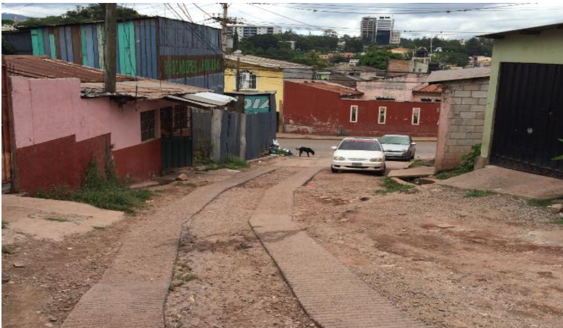
Foto 1: inicio de calle tramo a, pavimentacion contiguo a radiadores de honduras.