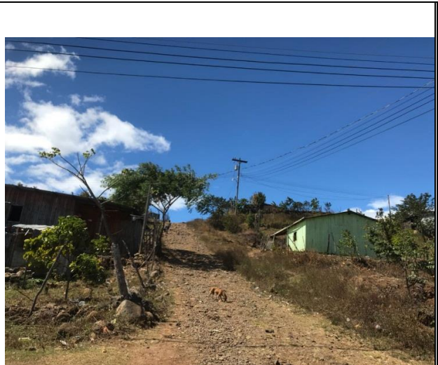
No. 2 Proyecto: CONFORMACION Y BALASTADO DE CALLES, COL. NUEVA CAPITAL, SECTOR 4 – COL. BERLIN Fecha: ENERO 2018