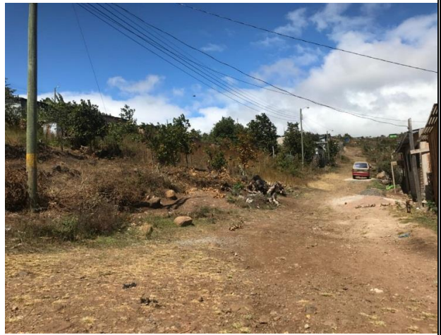
No. 1 Proyecto: CONFORMACION Y BALASTADO DE CALLES, COL. NUEVA CAPITAL, SECTOR 4 – COL. BERLIN Fecha: ENERO 2018