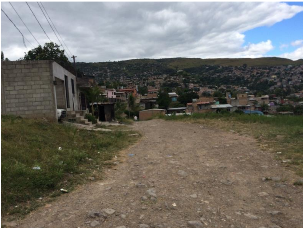
Vista panorámica de calle a pavimentar