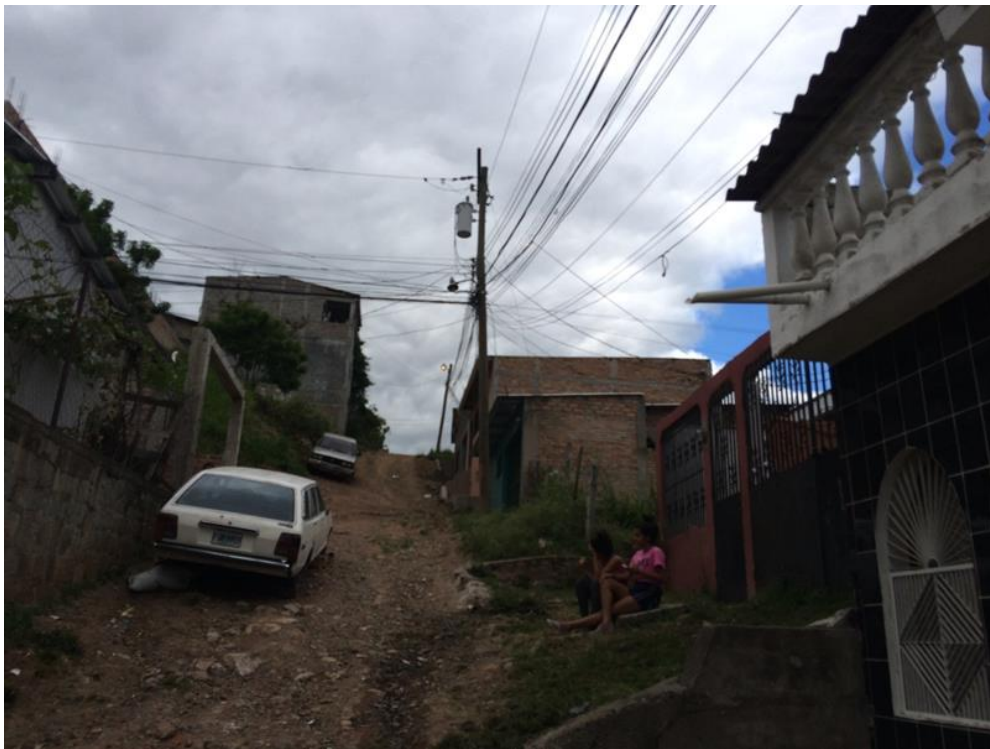
Vista de la condicion de calle a pavimentar