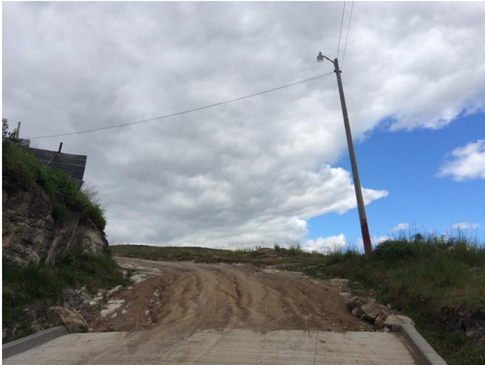
Inicio de calle a pavimentar

Proyecto: Pavimentación de calle con concreto hidráulico, col. Superación, sector 2, calle principal Código: 1452