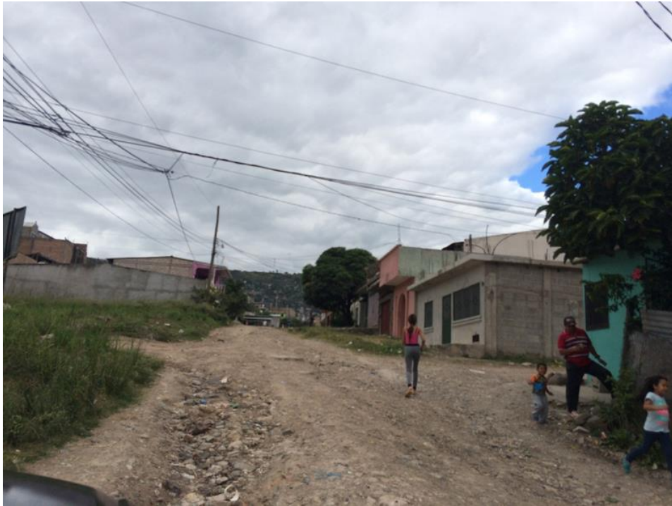
Vista del estado actual de la calle a pavimentar

Proyecto: Pavimentación de calle con concreto hidráulico, col. Superación, sector 2, calle principal Código: 1452