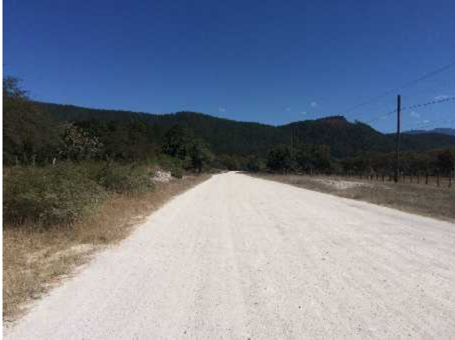
TRAMO A BALASTAR ALDEA LA VENTA