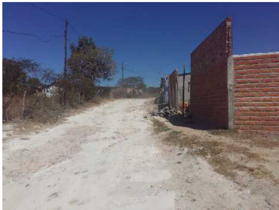
TRAMO A BALASTAR ALDEA ILAMAPA