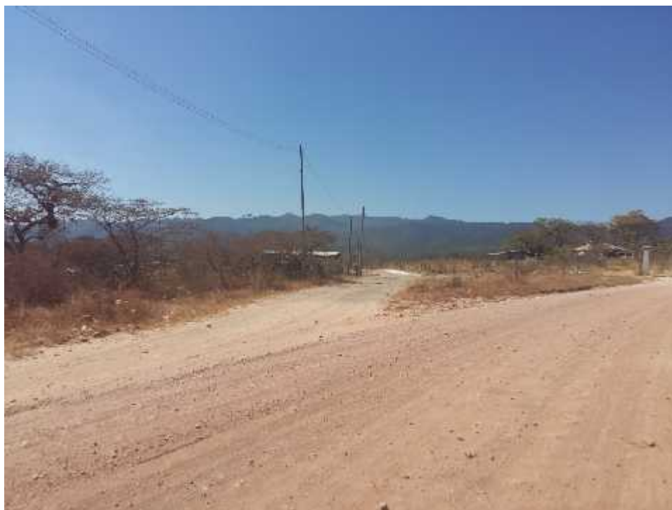
PARTE ALTA ALDEA ILAMAPA