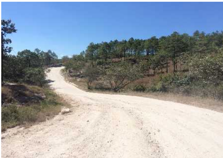
PARTE ALTA ALDEA LA VENTA