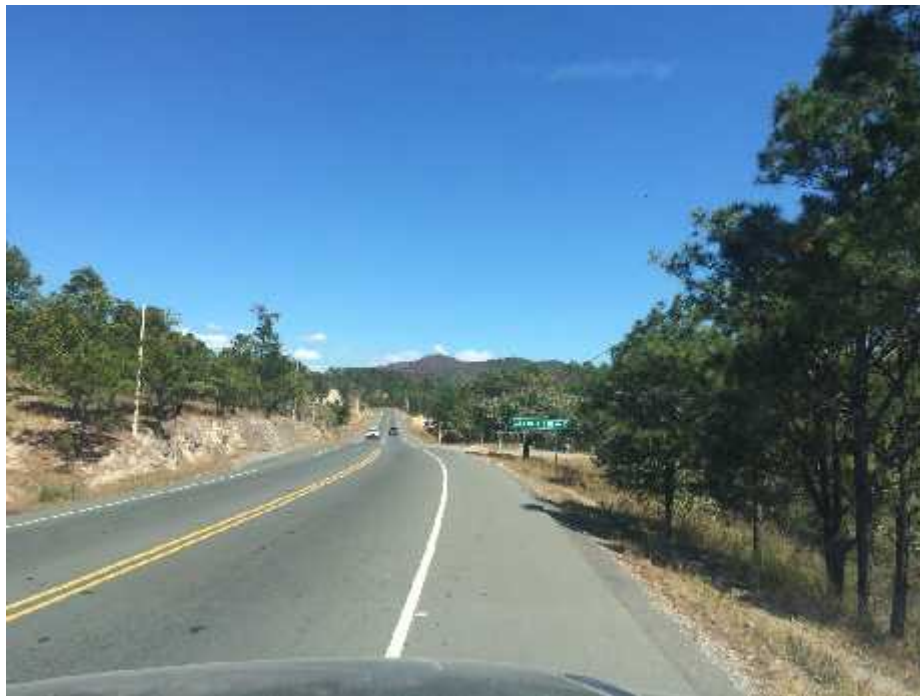
ACCESO ALDEA LA VENTA