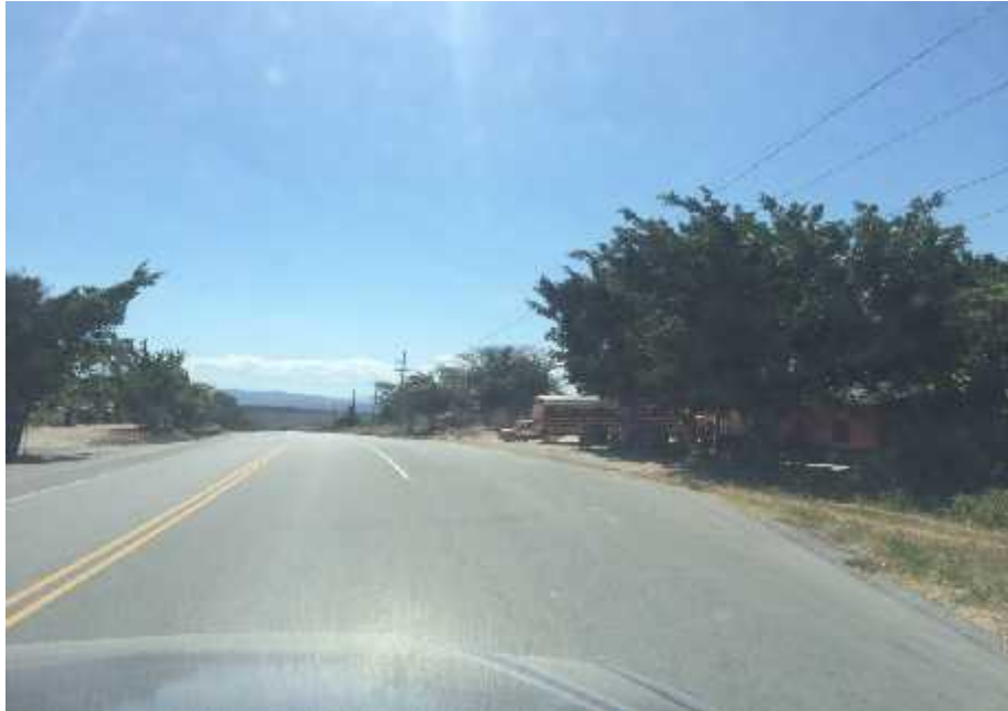
ACCESO ALDEA ILAMAPA