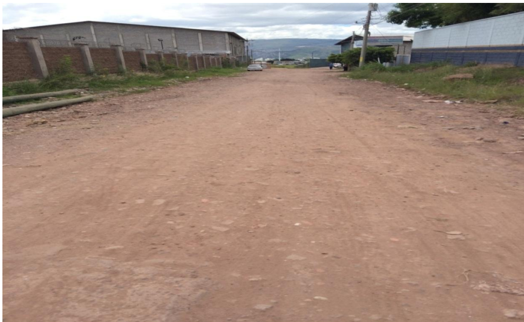
TRAMO FRENTE A ESCUELA GOLDEN SCHOOL