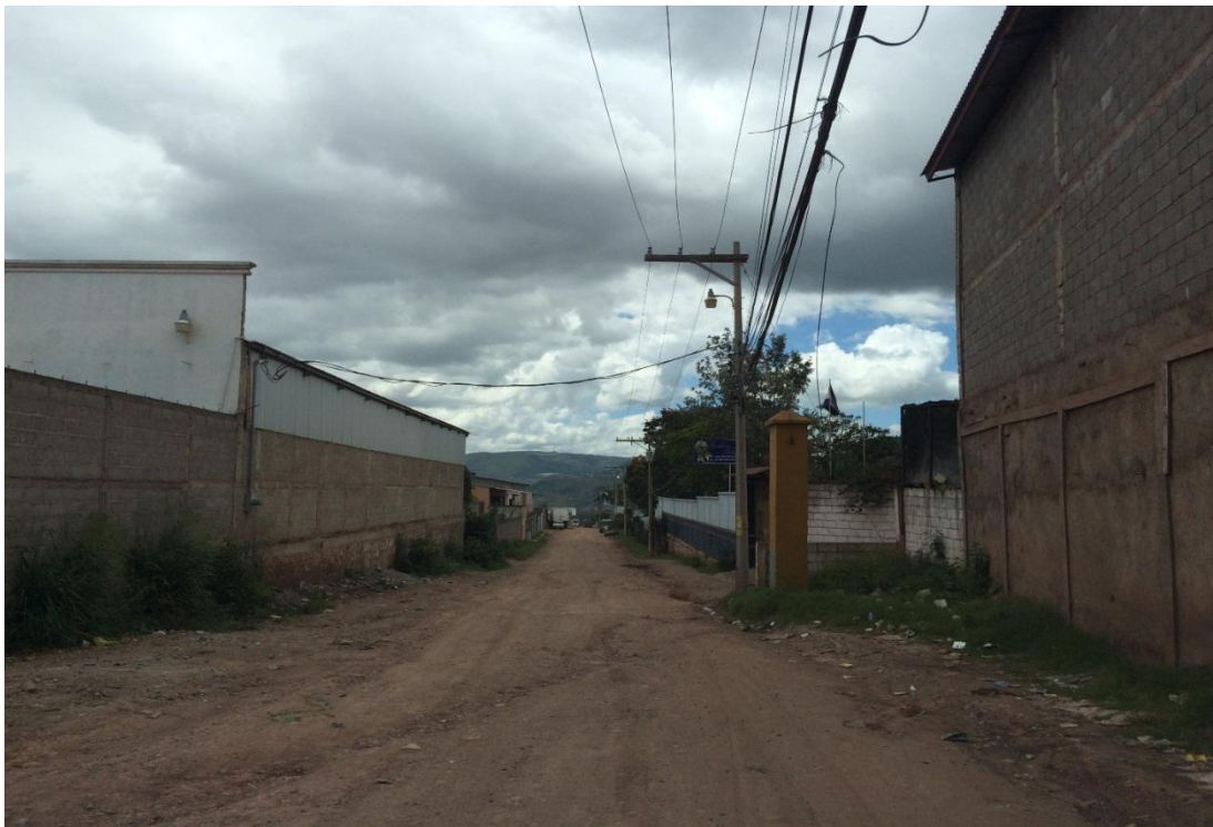
VISTA PANORAMICA DEL INICIO DEL TRAMO A PAVIMENTAR