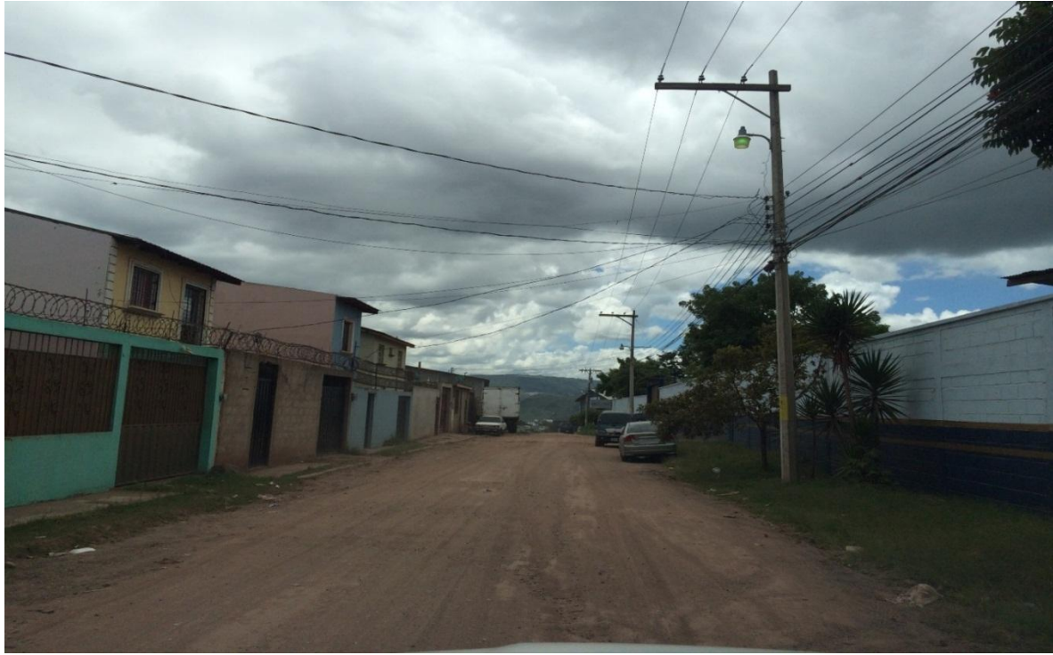
PARTE DEL TRAMO INCLUIDO EN EL PROYECTO