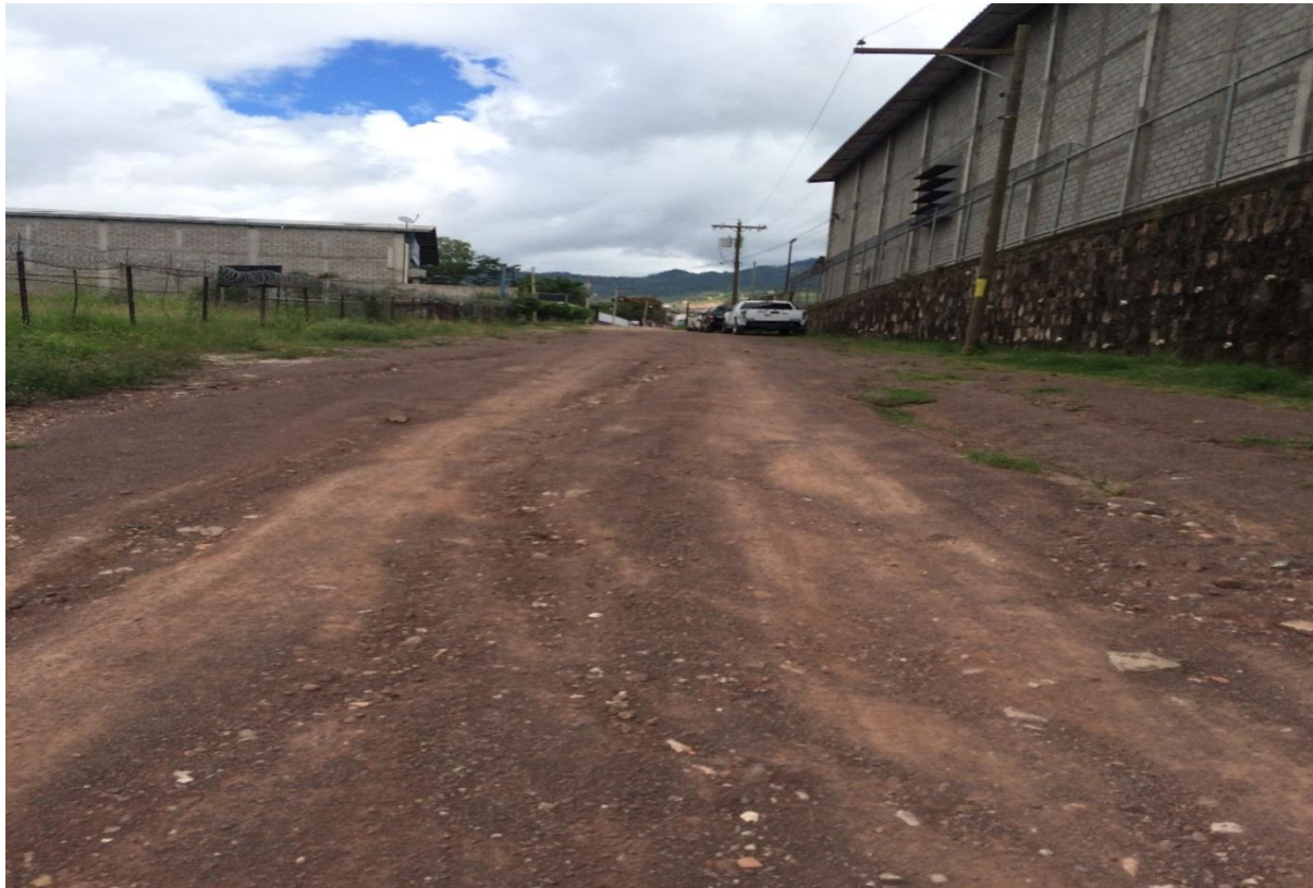
VISTA DEL FINAL DEL TRAMO A PAVIMENTAR