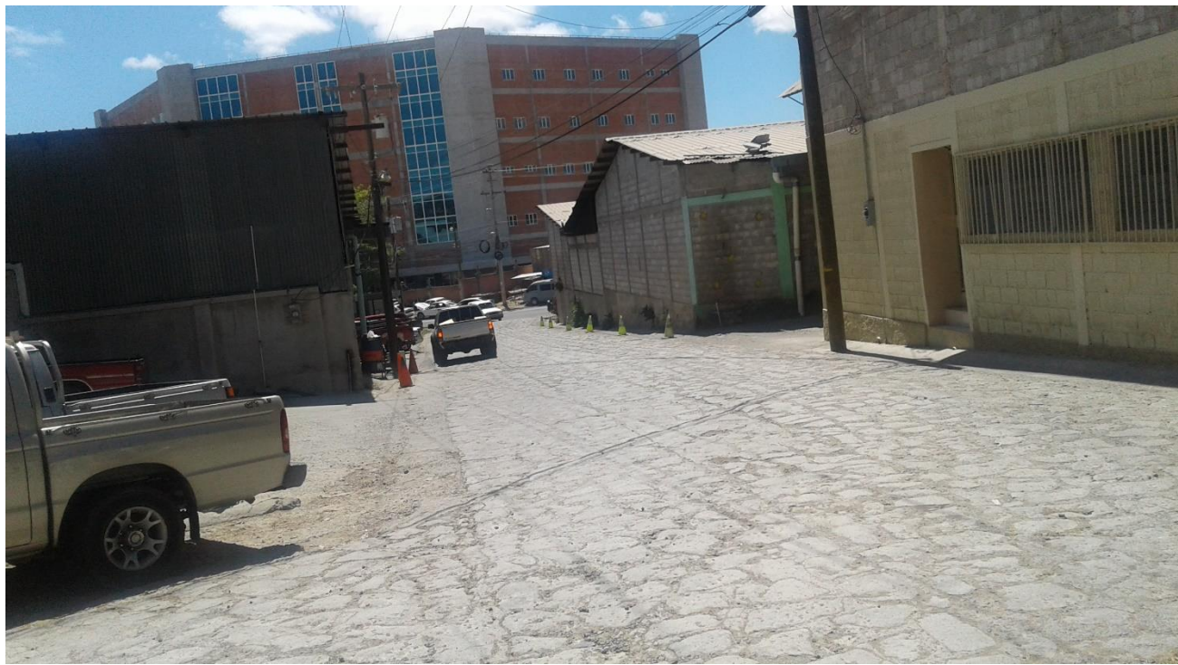
FOTO No. 1 VISTA DE INICIO DE LA MICRO-CARPETA DE LA CALLE