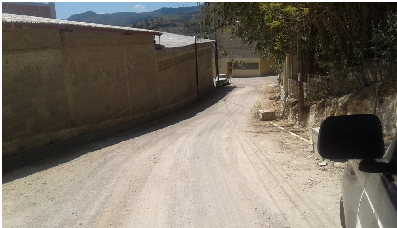
FOTO No 3 VISTA DE LA CALLE MICRO-CARPETA