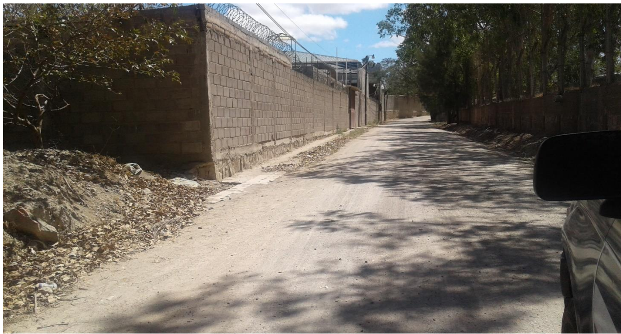
Foto No. 4 PAVIMENTACION DE CALLE MICROCARPETA