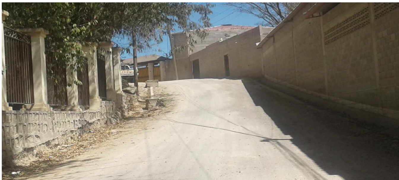
FOTO No. 2 VISTA PANORÁMICA DE LA CALLE