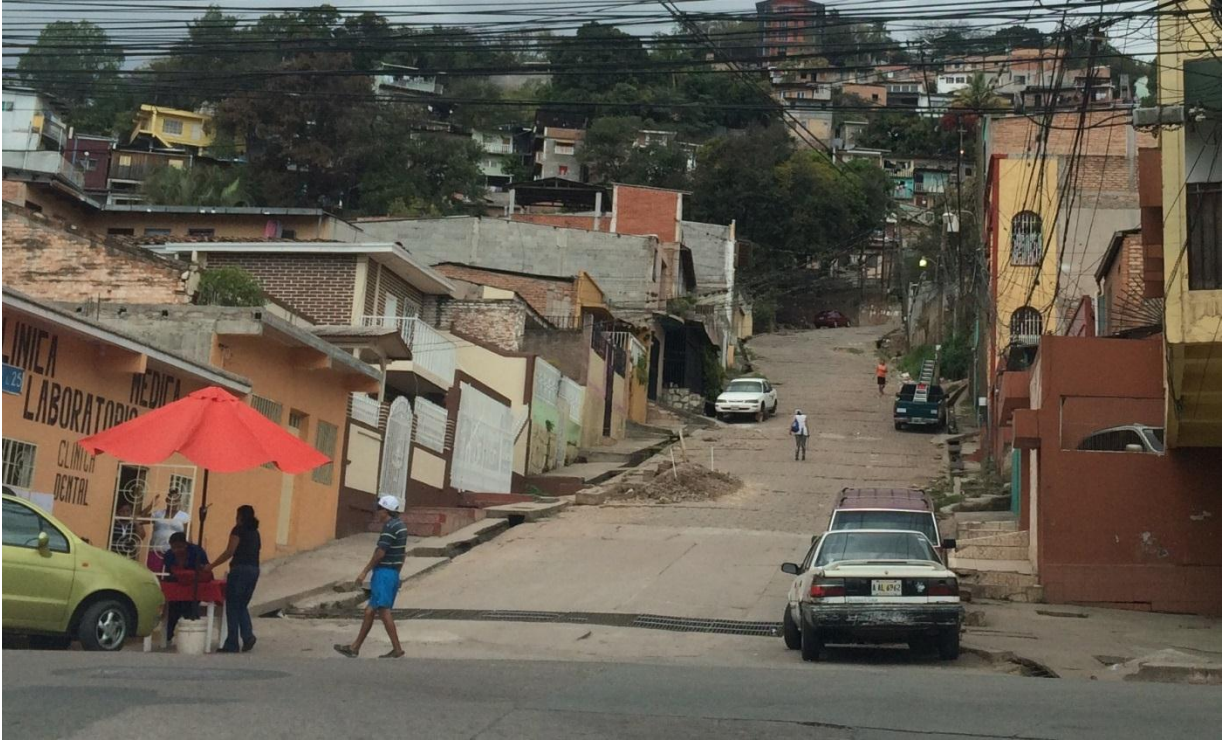
Vista del inicio de calle a reparar