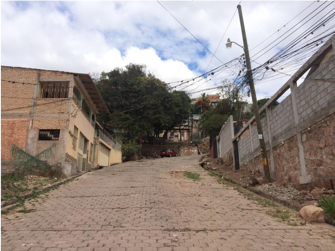
Vista panorámica de tramo a reparar