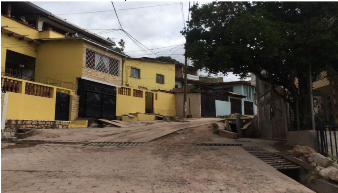
Vista del final de la calle