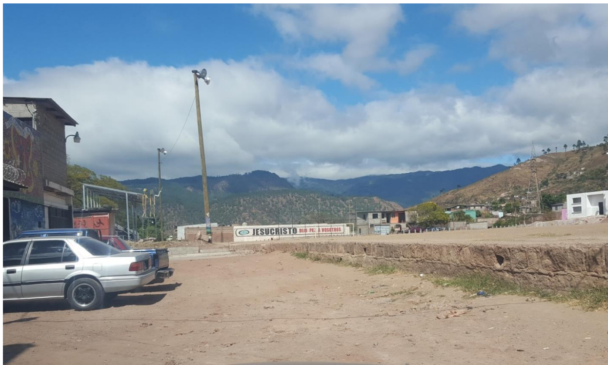
FINAL DEL TRAMO