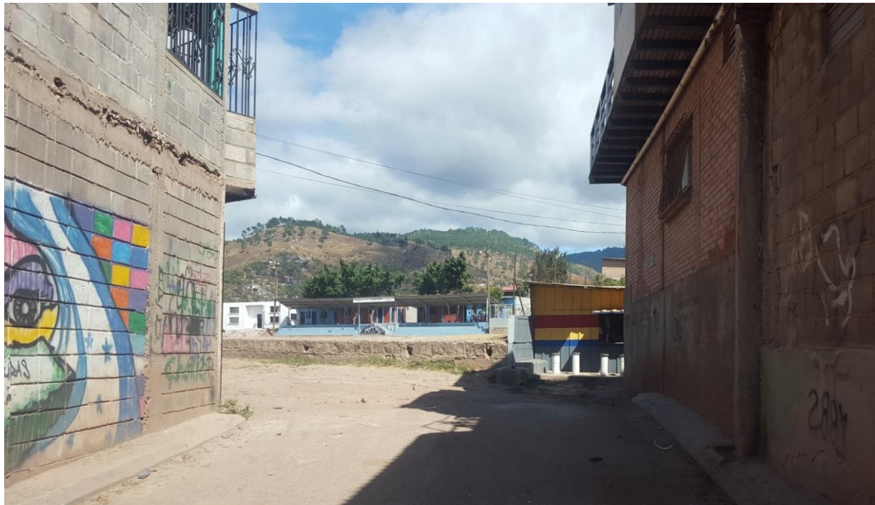
SECCIÓN DE TRAMO A REPARAR