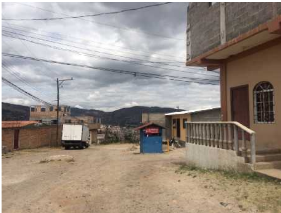
VISTA DE CALLE A REPARAR