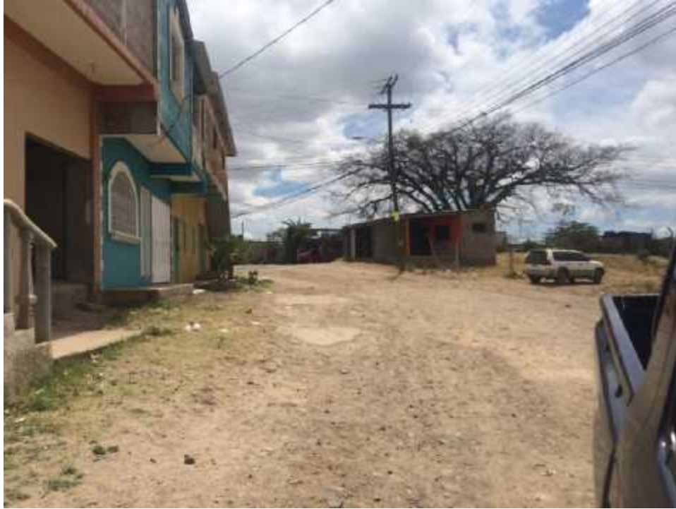
VISTA PANORAMICA DE TRAMO A REPARAR