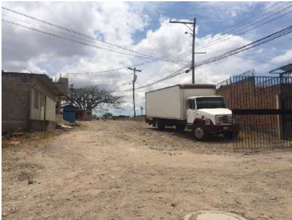
VISTA DEL FINAL DEL TRAMO