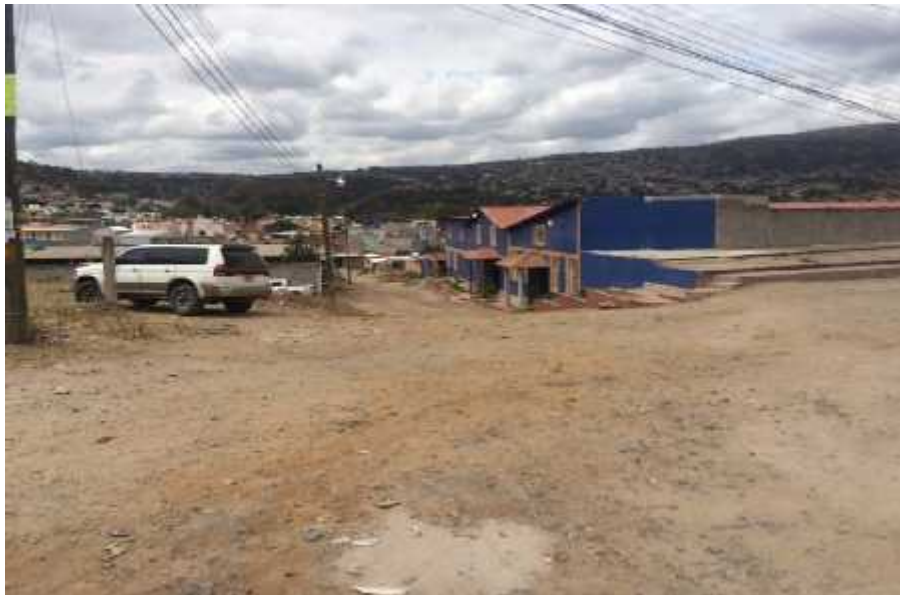
VISTA DEL INICIO DEL TRAMO